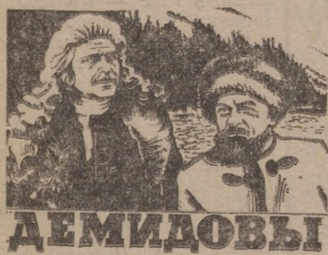
Чурсина. Приглашаем в кинотеатр!

С 11 по 15 января смотрите новый цветной широкоэкранный двухсерийный фильм Свердловской киностудии.