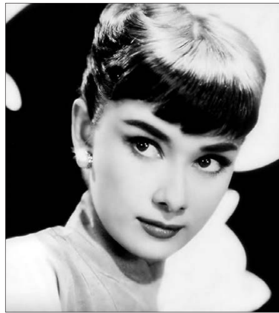
* «Стрелки», как у Одри Хепберн, вновь популярны.

С другой стороны — для молодых, дерзких и смелых стилисты предлагают самые