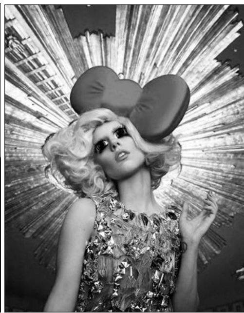
* Эпатажная Леди Гага.

неожиданные эксперименты в духе Леди Гага, которая не задумываясь ломает все стереотипы и красит корни волос... в желтый цвет! По тому же принципу, например, можно блондинкам сделать цвет волос красными, губы подкрасить оранжевой помадой, наложить контрастные фиолетовые тени... Скажете кич, безвкусица? Нет, это тоже образ, который эпатажная певица успешно тиражирует по всему миру, оттеснив на задворки мрачных бледнолицых «готов» и поднадоевших «эмо». Так что молодежи советую равняться на Леди Гагу.