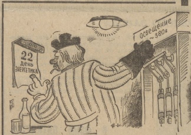
Рисунок М. Скатины.

— День энергетика на носу. Отключу-на освещение. Авось, и празднику премию выпишут.