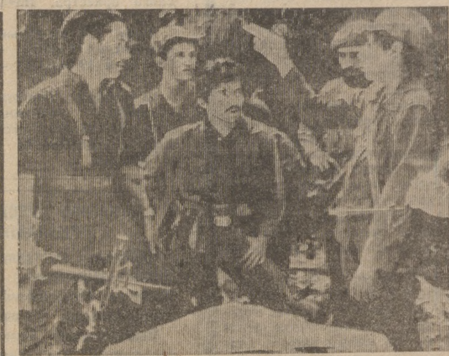
ПОВСТАНЦЫ Фронта национального освобождения имени Фарабундо Марти продолжают успешные боевые действия. Как признает военное командование Сальвадора, нынешнее наступление партизан является самым крупным

После такого «культурного обслуживания» настроение мое сразу потускнело, да и не только мое, у других покупателей тоже.