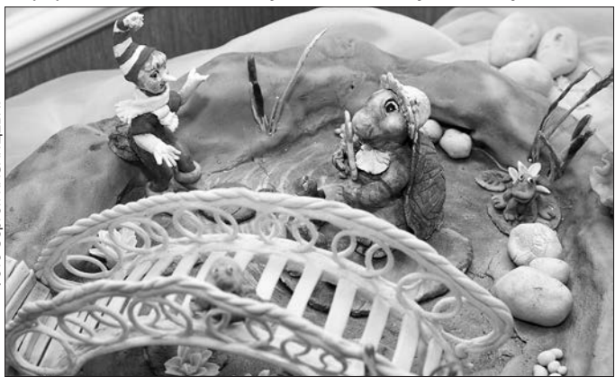
Работа Антона Приходько из соленого теста.