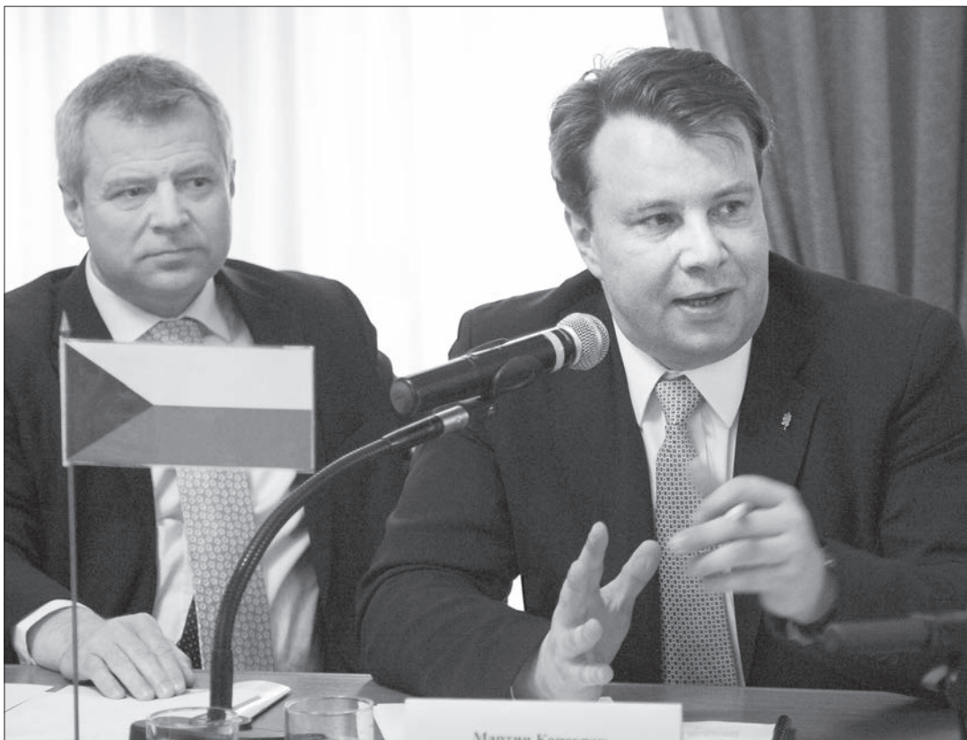
* Министр промышленности и торговли Чешской Республики Мартин Коцюрек и чрезвычайный и полномочный посол Чехии в Российской Федерации Петр Коларж.

Большая делегация из Чешской Республики побывала позавчера в Нижнем Тагиле. В ее состав вошли министр промышленности и торговли Мартин Коцюрек, посол Чехии в Российской Федерации Петр Коларж, генеральный консул ЧР в Екатеринбурге Мирослав Рамеш, чешские бизнесмены и промышленники.