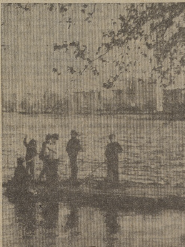
А вдруг повезет.