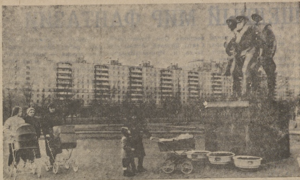
...Грозные дни конца 1941 года. Фашистские орды врываются к сердцу нашей Родины — Москве. Весь мир, затаив дыхание, следит за гигантской битвой на подступах к столице Советского Союза.

вила письмо для принятия довалась такой оперативной мерой, 14 ноября сообщила коммунальщикам. 20 ноября «Указанные недостатки по поводу плохого теплоснабжения дома № 27 по ул. Пушкина устранены». Напрасно редакция направ-