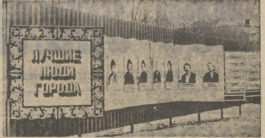
Городская галерея Почета находится на проспекте Ильича. Ее украшают фотографии передовиков производства, победителей соцсоревнования. Рядом — коллективные снимки лучших бригад, смен. Фотографии обновляются два раза в год — к 7 ноября и к Первомаю.

В галерее Почета названы лучшие предприятия города и показателя их работы. А также — итоги соревнования с Нижним Тагилом и Каменск-Уральским. Эти данные обновляются раз в квартал.