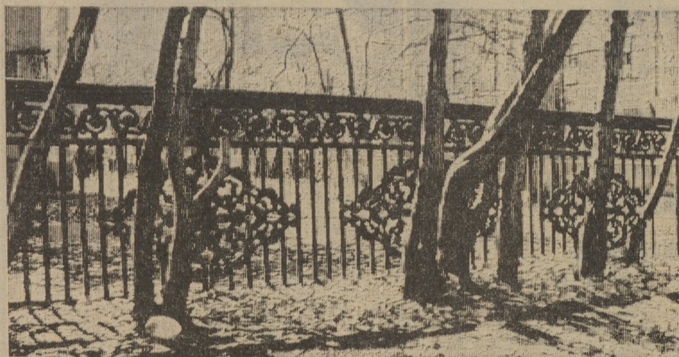
В ЛУЧАХ ОСЕННЕГО СОЛНЦА.