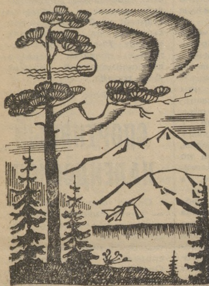
УРАЛЬСКИЕ ГОРЫ. Рисунок Ю. Коршева.

Ю. ЖУРАВЛЕВ, старший инженер отдела организации труда и зарплаты управления.