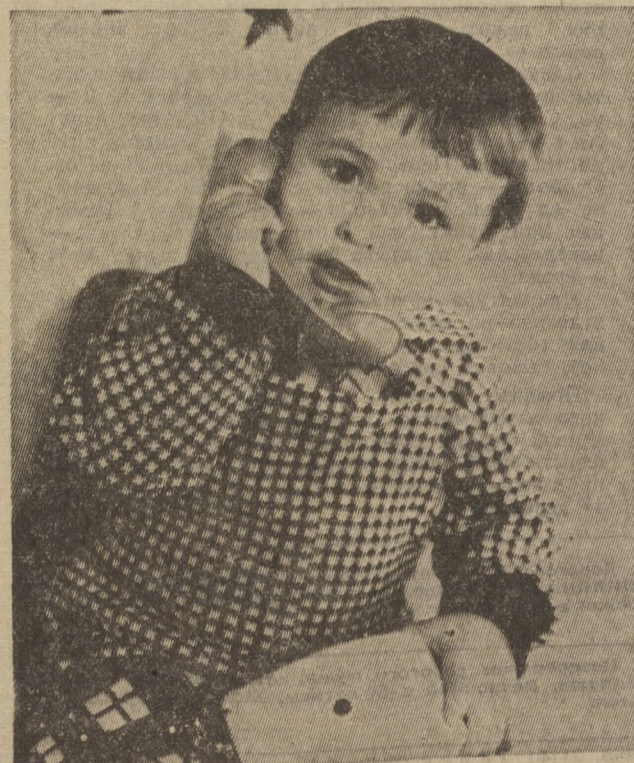
Поговорю с папой.

3 стр. ПОД ЗНАМЕНОМ ЛЕНИНА 8 августа 1986 г., № 154