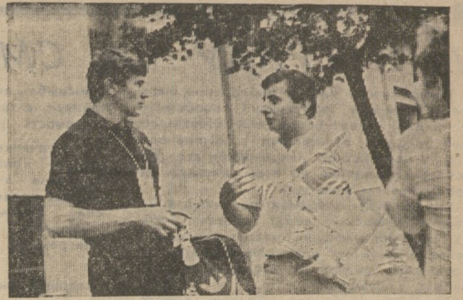
Популярный советский атлет Сергей Бубка, установивший новый мировой рекорд в прыжках с шестом — 601 см, встретился на пресс-конференции с журналистами, освещающими Игры доброй воли.