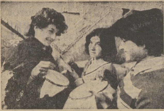
На этом снимке запечатлены воспитанники кабульского детского дома «Ватан» («Родина»). Их родители погибли от рук бандитов-душманов, помощь которым открыто оказывает американская администрация. В стенах «Ватана» круглые сироты — жертвы необъявленной войны, которую ведут против Афганистана империализм и реакция. Дети согреты вниманием и заботой педагогов, проходят трудовую и учебную подготовку.