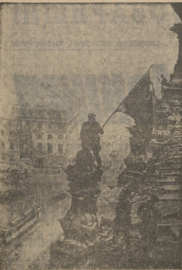
1945 год. Знамя Победы над рейхстагом в Берлине.

Берлин горел. Берлин сдавался. Клубились грозно облака. ...Вот на рейхстаге расписался Солдат из нашего полка. И тут взмогла над ним Победа, Как вешний гром среди тишины. Она за ним ходила следом По всем фронтам его войны. Среди смертей, огня, металла... Но пробил час. Слезой в глазах Победа пела и плясала На всех берлинских площадях. А. ЯМЩИКОВ.