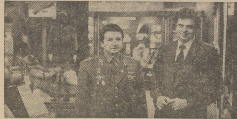
Юрий Алексеевич Гагарин. (София, май 1961 года).

Экипаж космического корабля «Союз Т-15»: командир экипажа летчик-космонавт СССР, дважды Герой Советского Союза Л. Д. Кизим (слева) и бортинженер летчик-космонавт СССР, Герой Советского Союза В. А. Соловьев в Музее космонавтики Вяздского городка.