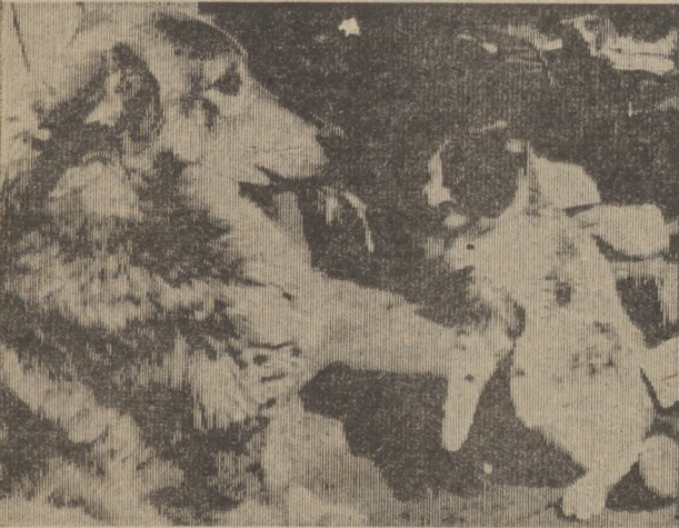
НЕПРАВДА, ЧТО КОШКА С СОБАКОЙ ВРАГИ.