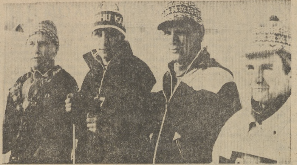
Редактор С. И. ЛЕКАНОВ.