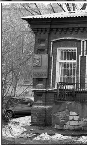
* Возможно, здесь когда-нибудь будет музей семьи Окуджавы.

рийным, деньги на ее ремонт будут выделены. Город никого не бросит и не оставит без внимания.