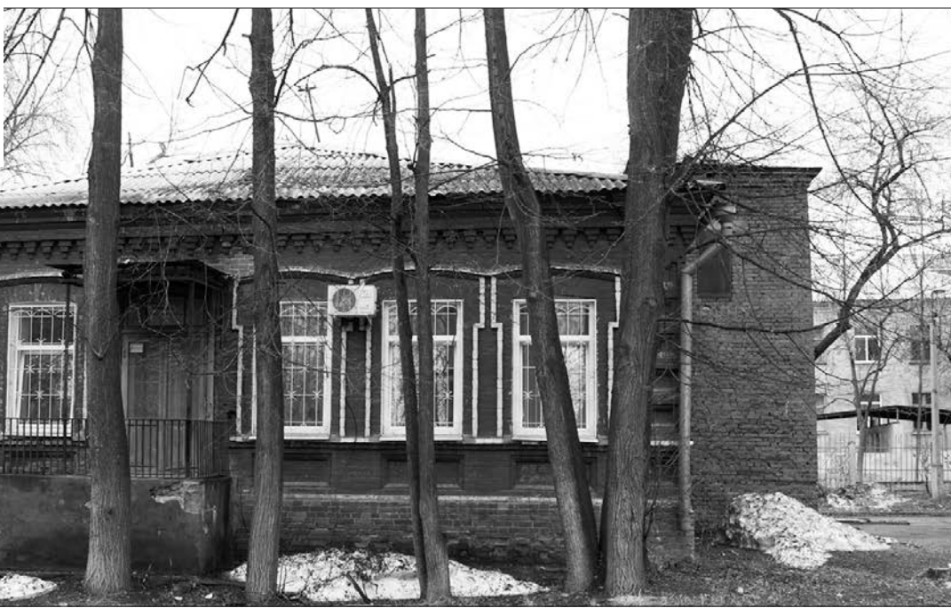
* Возможно, здесь когда-нибудь будет музей семьи Окуджавы.