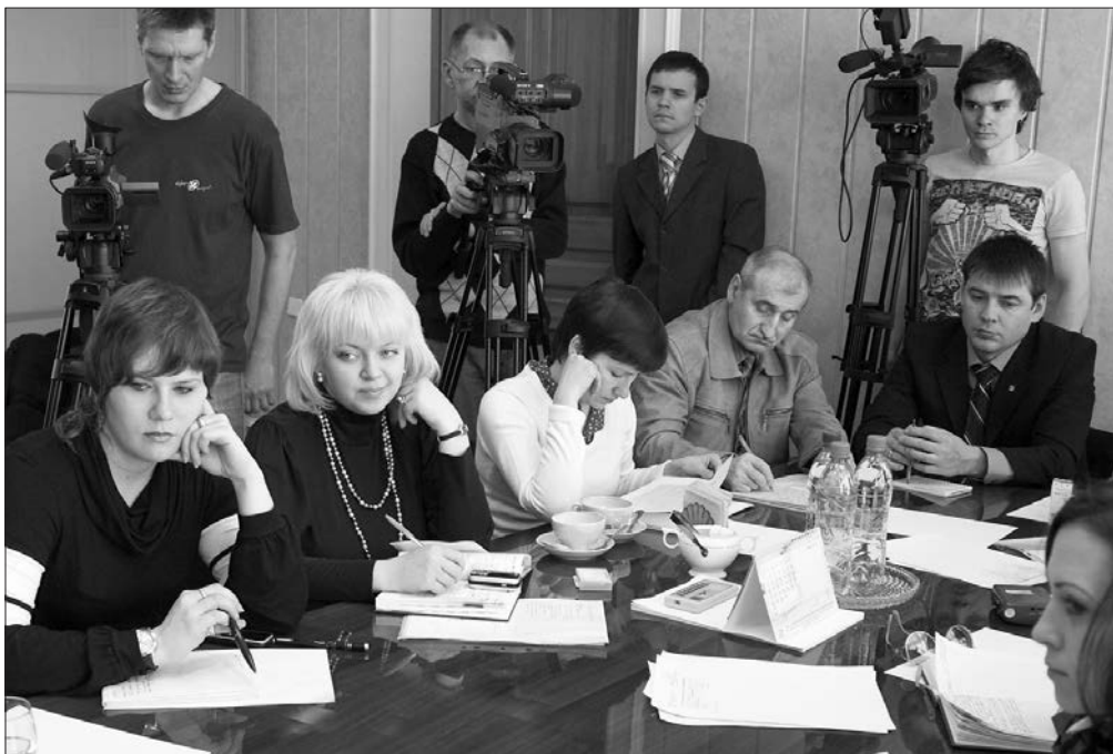
* Журналисты - участники встречи.