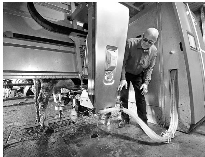
В передовых животноводческих хозяйствах региона роботы-дойры давно не в новинку.

Soft skills помогают решить любую проблему и грамотно управлять своими ресурсами. К тому же эти навыки, по мнению Третьяковой, именно то, что отличает людей от роботов. Эксперты доказывают: искусственный интеллект не сможет заменить человека во многих сферах, например, в науке, где требуются нестандартные решения, или в тех профессиях, где важно живое общение. ●