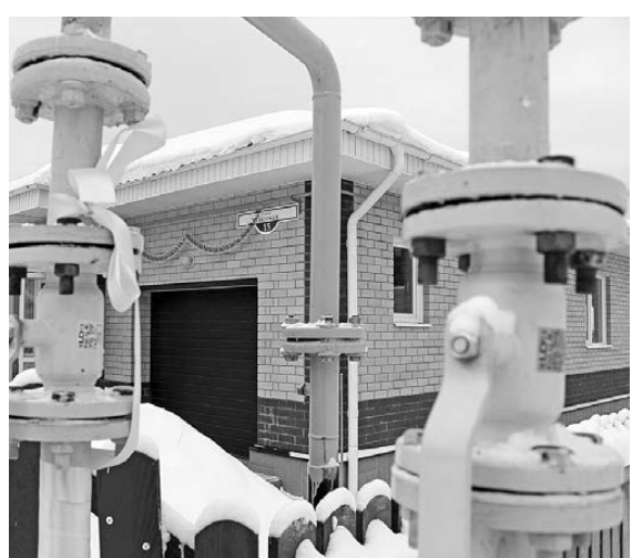
Подключение к газу частных домов позволяет их жителям обходиться без дров и существенно экономить на топливе.