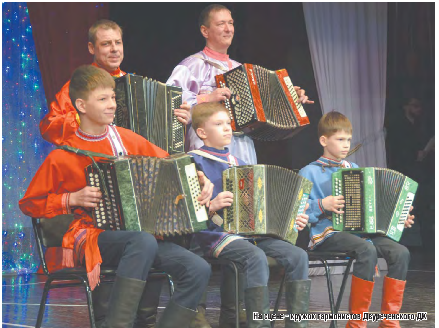
На сцене - кружок гармонистов Двуреченского ДК