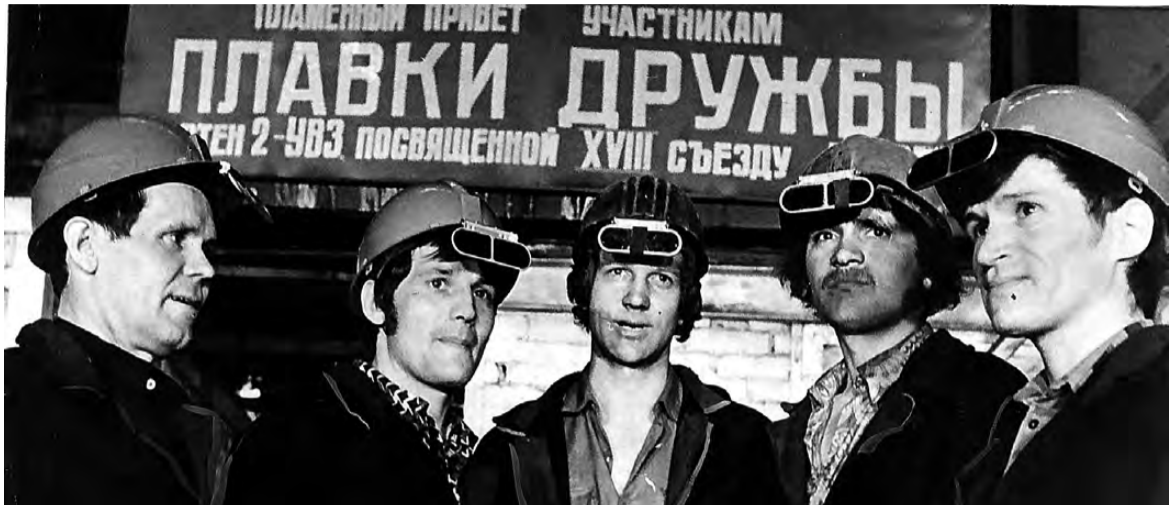
1978 год. Плавка Дружбы.

Свято чтут на ЕВРАЗ НТМК память о фронтовиках, не вернувшихся с полей сражений Второй мировой. Их имена высечены на памятнике, установленном в ознаменование Победы. Ежегодно 9 Мая ветераны и молодежь несут к нему цветы и венки. А в далекие 30-40-е юноши и девушки готовили себя к защите Отечества. Они занимались спортом, прыгали