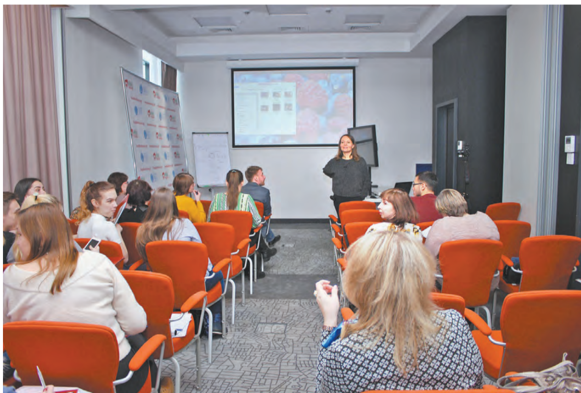
На семинаре по детскому паллиативу собрались медики, психологи и волонтеры.

В отсутствие паллиативных служб эти дети находятся за закрытыми дверями, и никто толком не знает, сколько их. Тем не менее, по экспертной оценке, у нас по стране минимальное количество детей, которые нуждаются в паллиативной помощи, – 180 тысяч. Сколько помощь получают – я вам не отвечу. Могу сказать, что в Москве таких детей 3,5 тысячи. Все организации, которые занимаются помощью, охватывают примерно тысячу из них. Это мало. Что касается удаленных территорий, даже не таких городов, как Нижний Тагил, а городов поменьше и