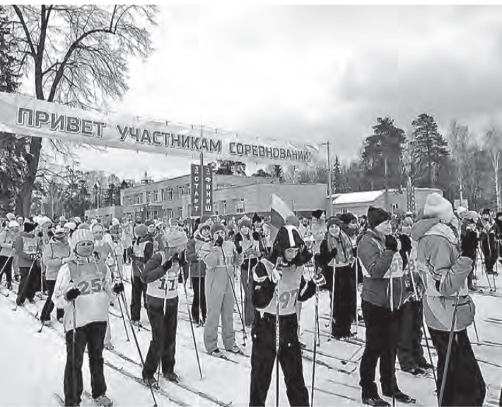
На старте участники педагогической «Снежинки».