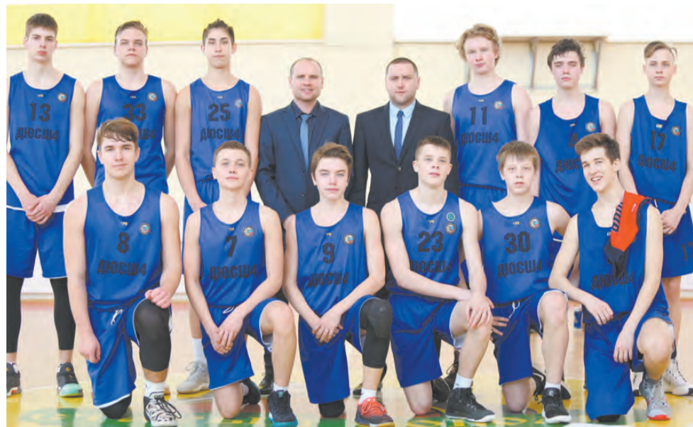
Команда СШ №4 – финалист первенства России.

УОР №3 (Химки) - СШ №4 - 66:41; СШ «Старый соболь» - СШОР №1 Калининского района (Санкт-Петербург) - 112:81;