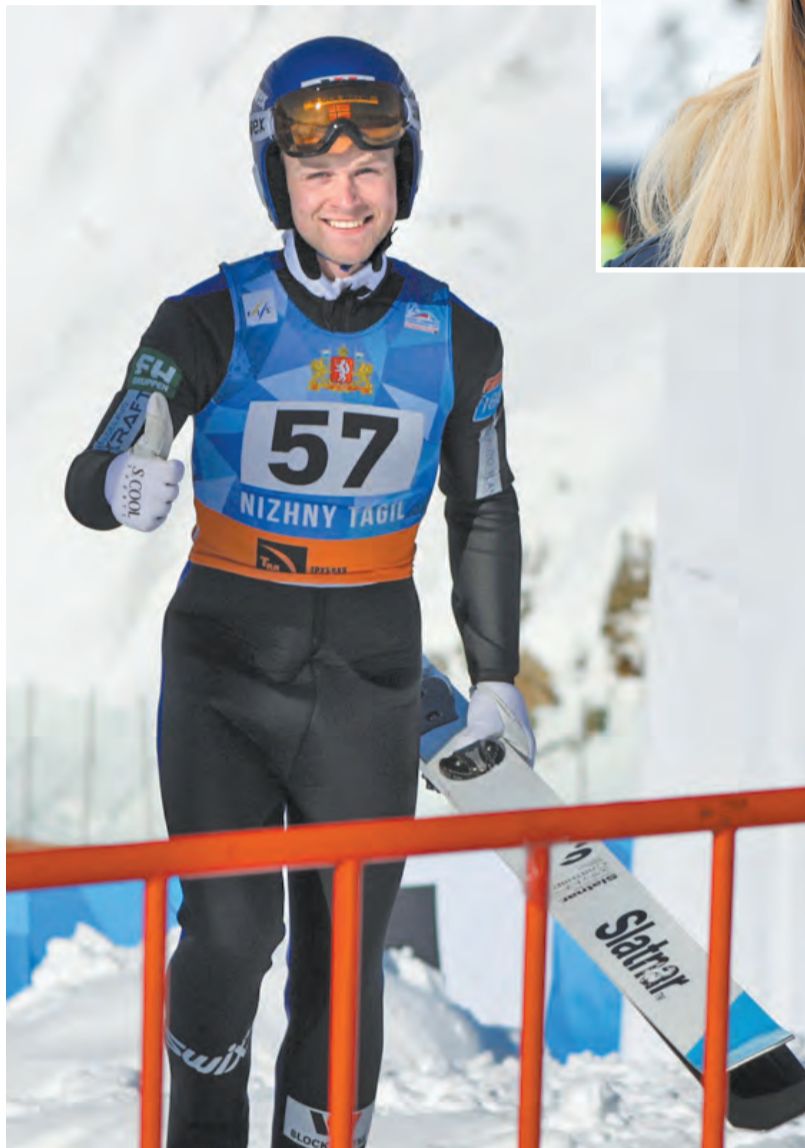
У двоеборца из Норвегии отличное настроение.