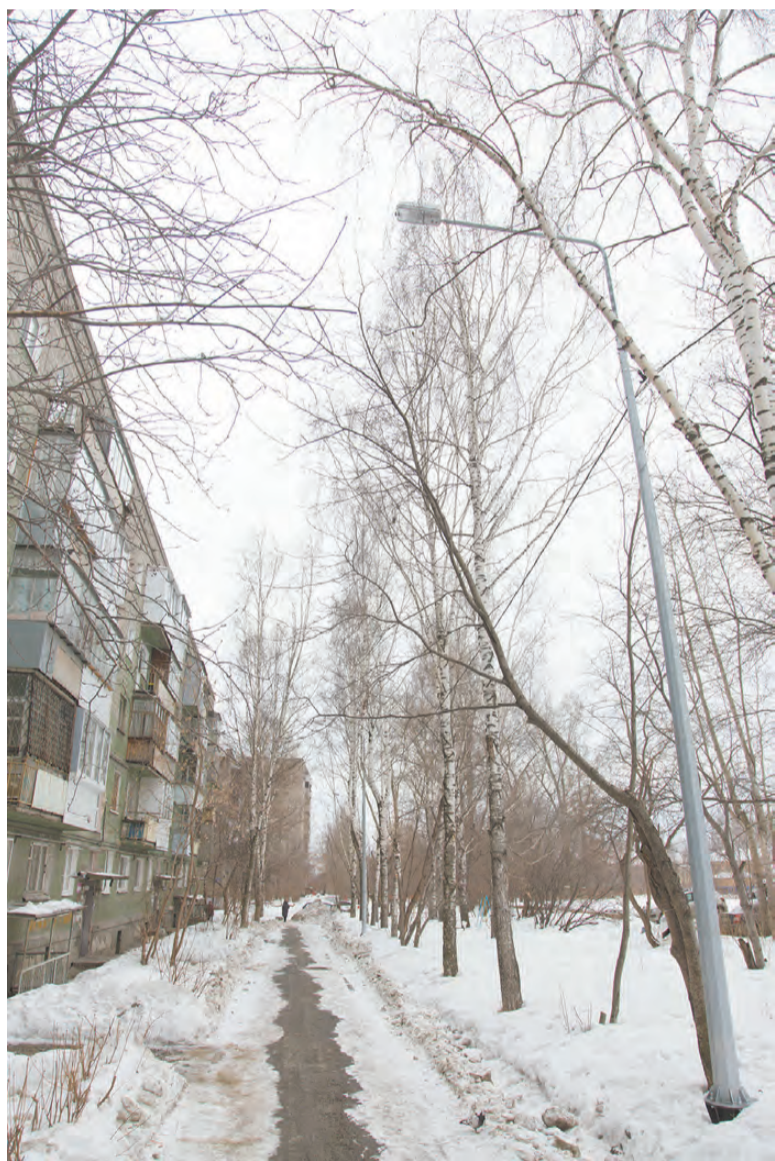
На улице Черных,48.