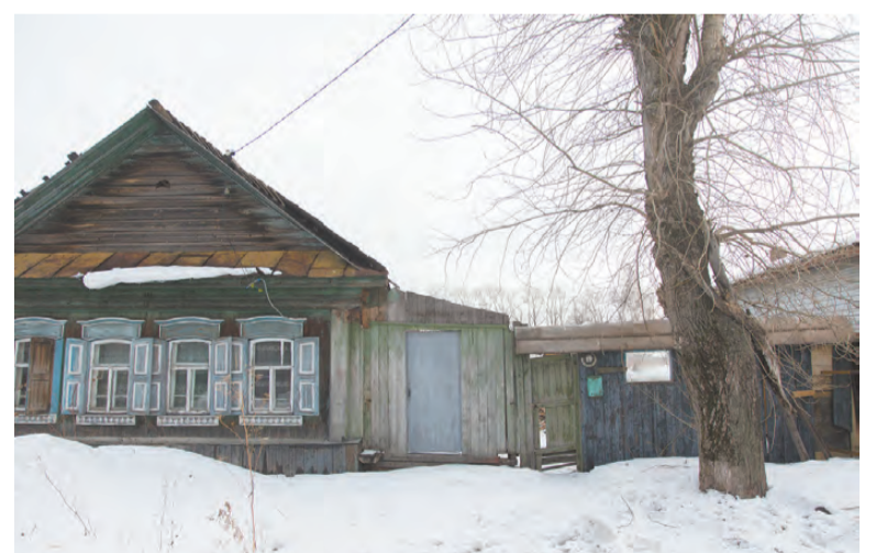
Тополь на ул. Железнодорожной, 19.