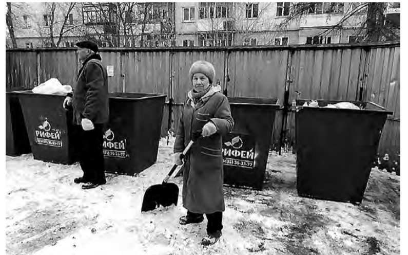
Новые контейнеры во дворе на ул. Газетной, 87.

Возьмем еще один пример. Семья круглый год живет то в