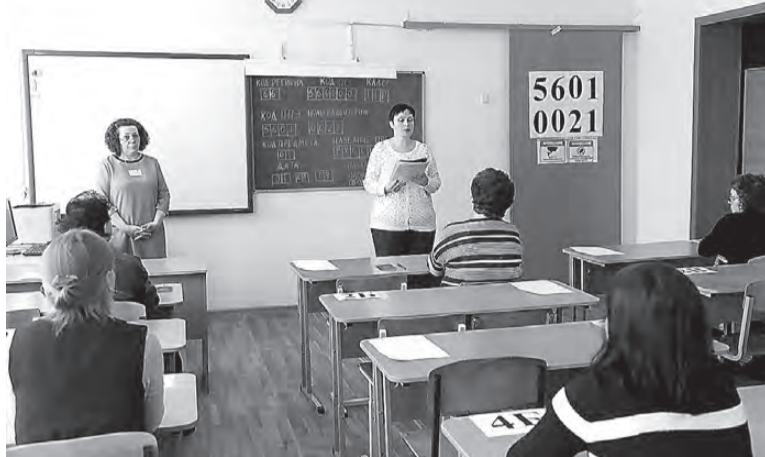
Инструктаж по заполнению экзаменационных бланков.

Как и в дни ЕГЭ для школьников, на большинстве кабинетов, на шкафах и даже на окнах были наклейки «Опечатано». На дверях красовались предупреждения о том, что нельзя проносить с собой телефоны и в аудитории ведется видеона-