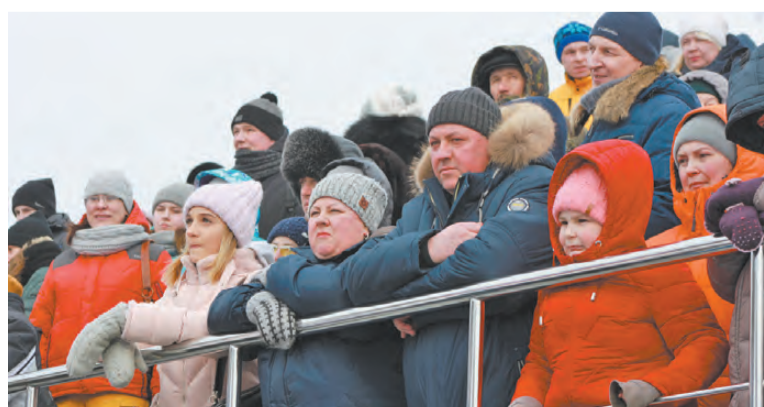
Тагильчане болели за представителей сборной России.

- Проводить соревнования международного уровня - престижно, это популяризация города, - сказал мэр. - Спортсме-