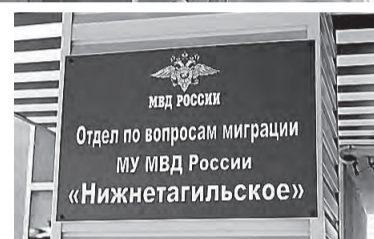
Отдел миграции находится на улице Победы.

- лица, имеющие гражданство бывшего СССР, получившие паспорт гражданина РФ, у которых полномочным органом не было определено наличие