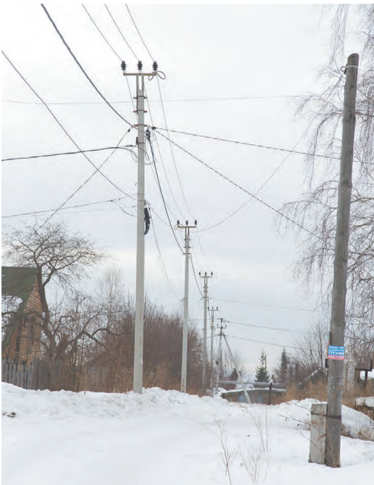
Темный край на улице Украинной.

- На выборах мы голосовали за благоустройство своего двора. Территория расположена между домов №25, 27, 27а и 27б. Проект был красивый, но до реализации дело не дошло. Могут ли администрация района или глава города помочь нам попасть в программу благоустройства?