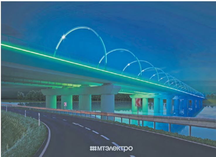
Дугообразные опоры – главная особенность моста.