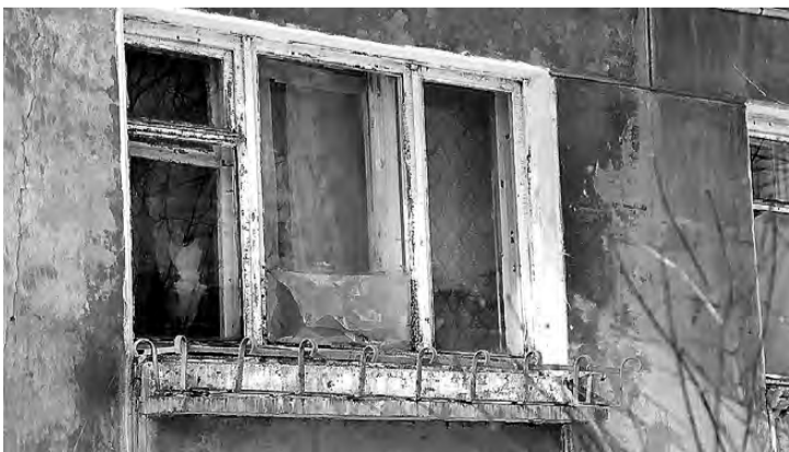
Окна квартиры №4.

«ТР» рассчитывает, что на этот сигнал могут откликнуться родственники Марии Солдатовой, общественные организации или социальные службы, но прежде всего мы надеемся на самых обычных горожан, располагающих возможностями для ремонта окон. Просим написать на электронную почту редакции или позвонить нам.