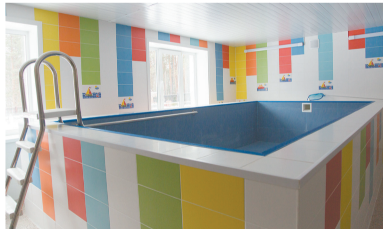
Обновленный бассейн. Его любят все дети.