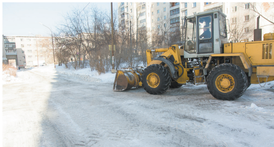
За чистотой двора следит УК «Квартал-НТ».