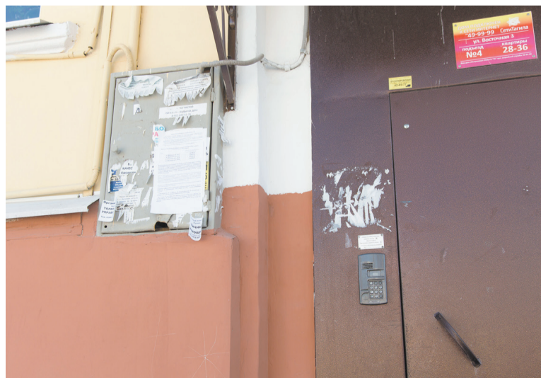
Листы с информацией для должников приклеены где придется и портят внешний вид дома.