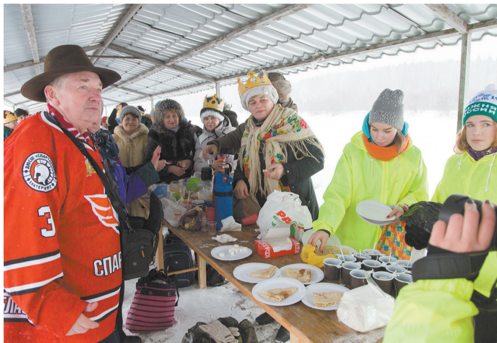
Всех угощали блинами и чаем из большого самовара.