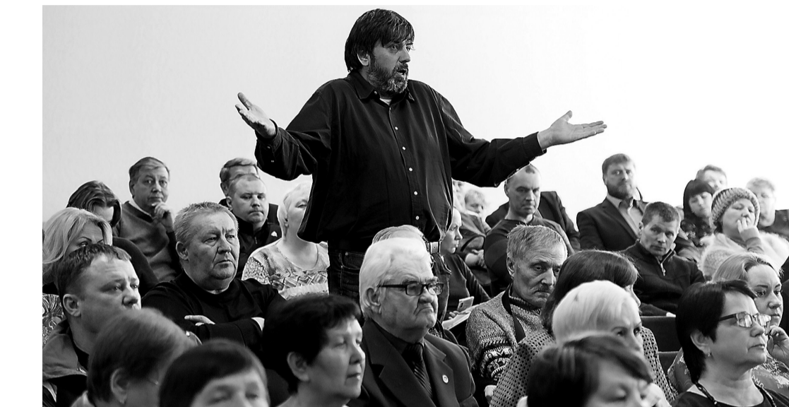
Вопрос из зала.

Затем все спикеры заявили о том, что реформа в Северном АПО стартовала успешно: ни один город или село не зарос-