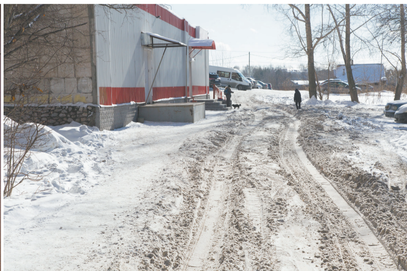
По этой дороге ни пройти ни проехать.