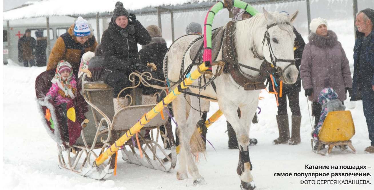
Катание на лошадях – самое популярное развлечение.