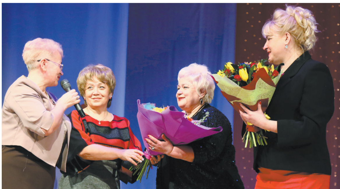
В праздничный день женщинам – цветы.

Уникальный праздник, посвященный одновременно прошедшему Дню защитника Отечества и предстоящему Международному женскому дню, прошел вчера в ГДДЮТ. В числе приглашенных – 450 педагогов, руководителей образовательных учреждений, лидеров профсоюзных организаций в школах.