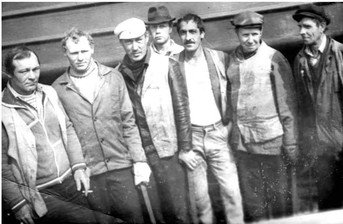
1980-е годы. Работники путевой машинной станции.

Каждая фотография должна сопровождаться информацией о том, когда и где она сделана, что на ней изображено (или кто изображен), от кого получена.