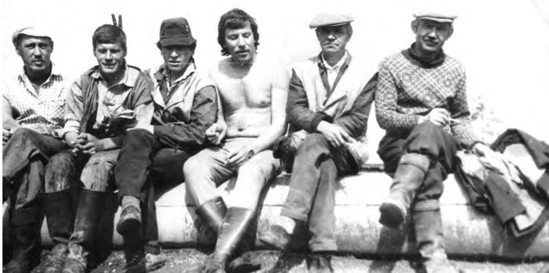
1980-годы. Бригада ремонтников путевой машинной станции.