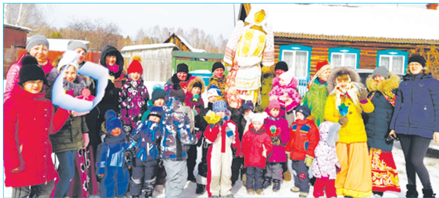
Участники веселой Масленицы в Октябрьском

Гуляния в Травянском прошли у ДК, здесь уже с утра звучали народные песни.