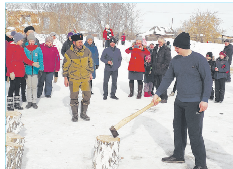
Конкурс «Расколоть колуном дрова»