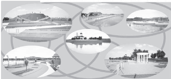
Арамил! Проектируй своё будущее!

В результате набережная у Храма набрала 57% голосов. На втором месте - 37% голосов - прилегающая к парку территория на ул. Садовая.