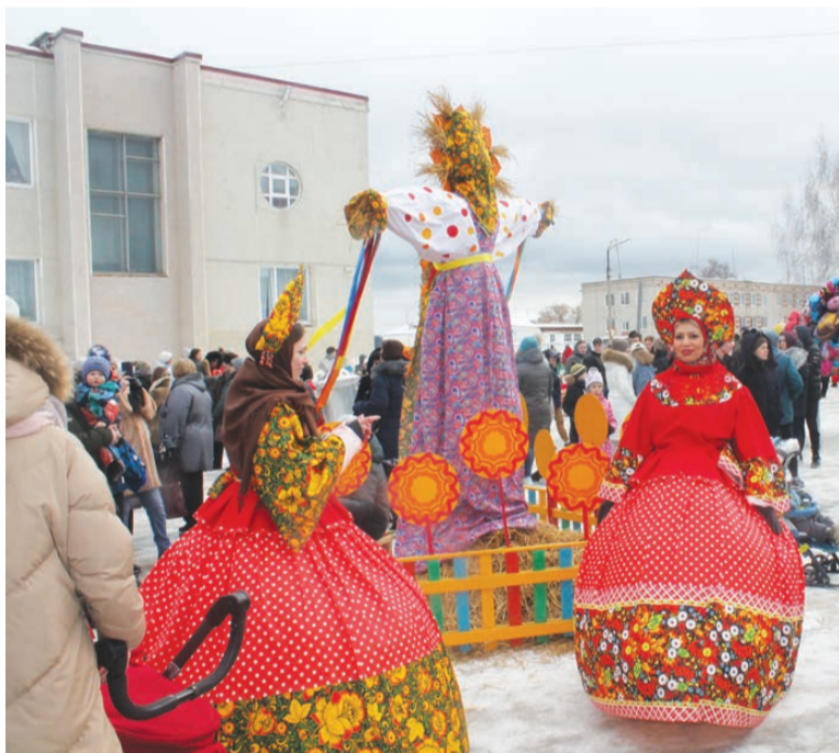
Вот таких красавиц можно было встретить на празднике