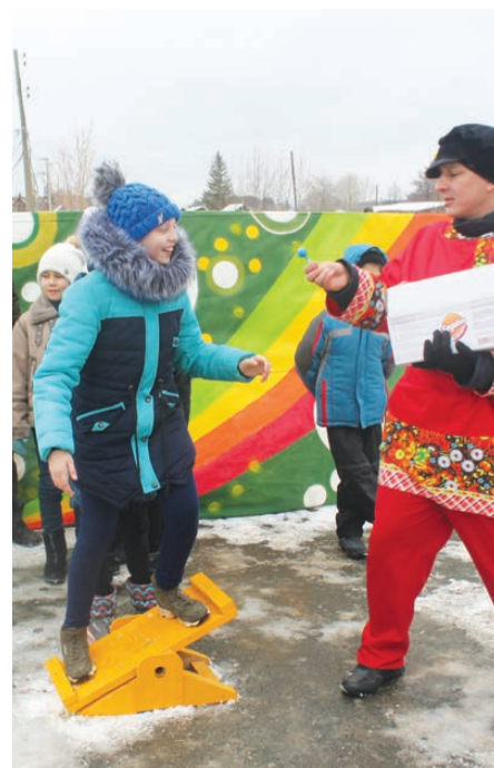
Удержал равновесие - получи чупа-чупс!