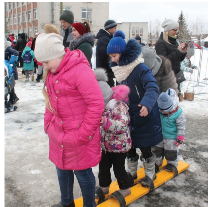
Сэкономили на лыжах...