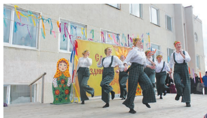
Какой праздник без веселых танцев?