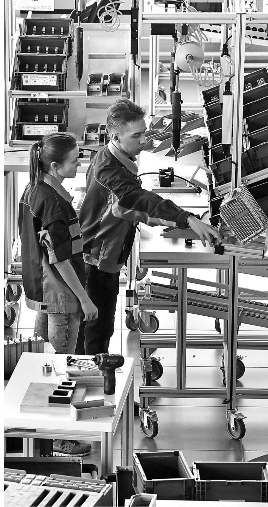
Молодежь готова идти на производство, если там им предлагают достойную зарплату и интересную, творческую работу на новом оборудовании.