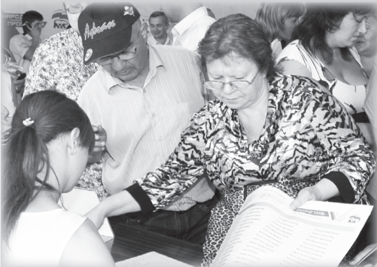
Кандидаты от «Единой России» должны заручиться поддержкой земляков