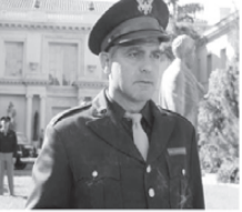
01.00 «СЕАНС ДЛЯ ВЗРОСЛЫХ»: «ПОД МАСКОЙ» 03.00 ДЖОРДЖ КЛУНИ, ТОБИ МАГУАЙР, КЕЙТ БЛАНШЕТТ В ФИЛЬМЕ «ХОРОШИЙ НЕМЕЦ»