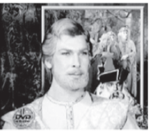
13.05 Х/Ф «РЕСПУБЛИКА ШКИД» 15.00 Х/Ф «ТРЕВОЖНЫЙ ВЫЛЕТ» 16.40 Х/Ф «СИЦИЛИАНСКАЯ ЗАЩИТА»