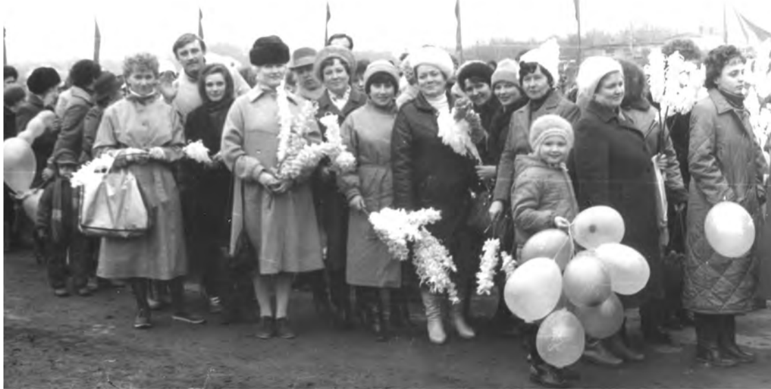
7 ноября 1984 г. Работники РАЙОНО на демонстрации.

Каждая фотография должна сопровождаться информацией о том, когда и где она сделана, что на ней изображено (или кто изображен), от кого получена.