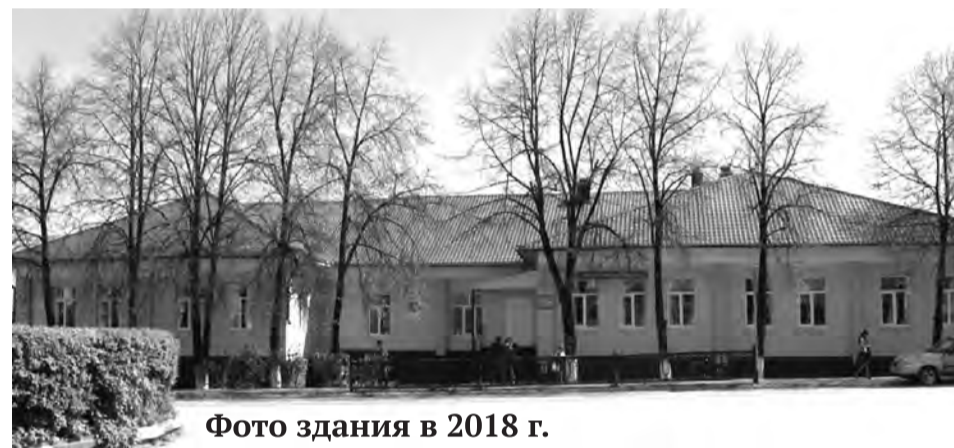
Фото здания в 2018 г.