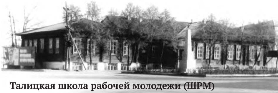
Талицкая школа рабочей молодежи (ШРМ)

Мужское училище, - писали газеты того времени, - «стало образцовым про-