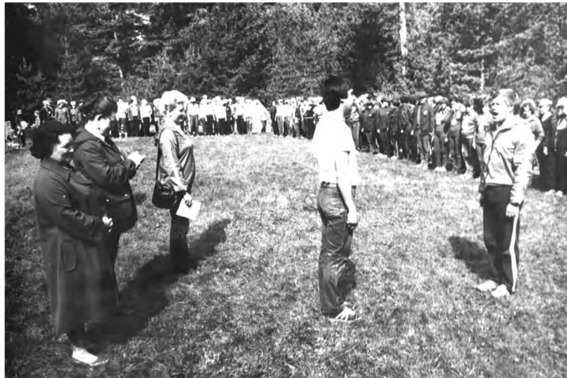
Июнь 1986 г. Турслет учителей Талицкого района.