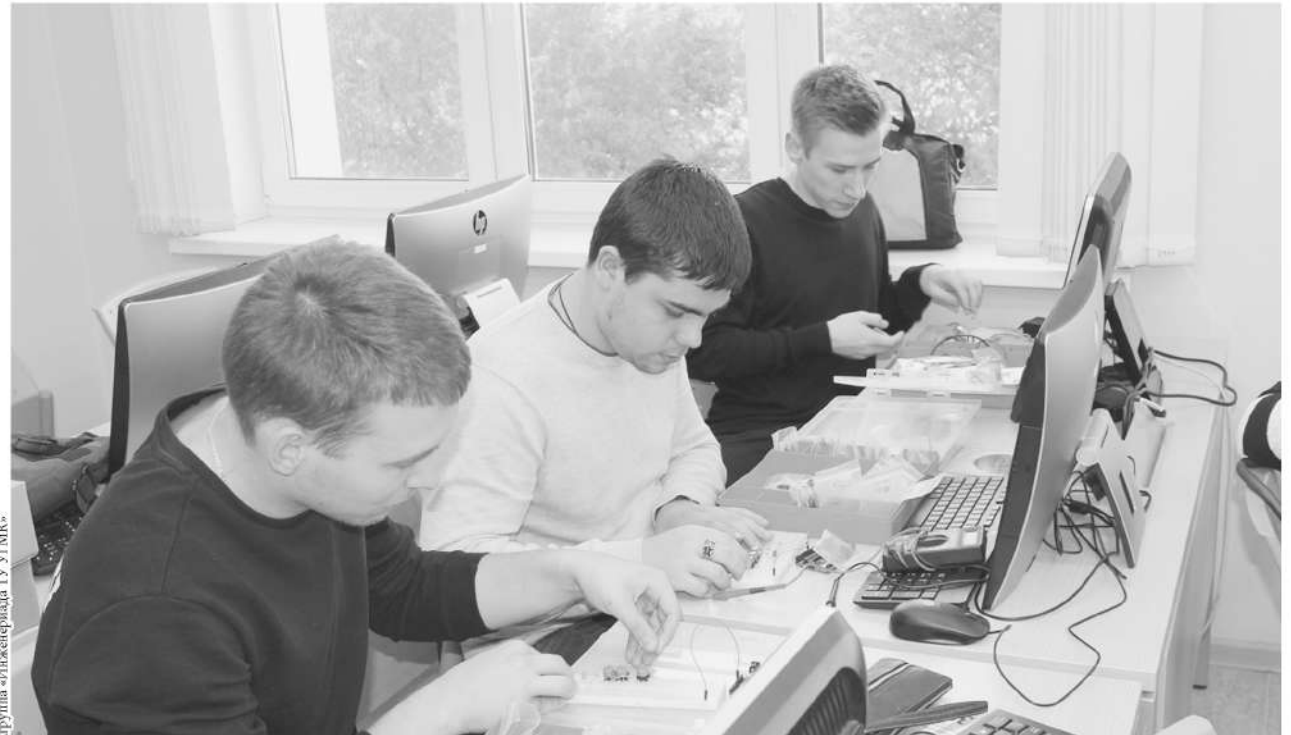
Привлекается внимание детей и молодежи к проектной деятельности в научно-технической сфере, а сами разработки оценивают эксперты – представители крупных предприятий Свердловской области, технологические предприниматели, представители власти и вузов.

За эти годы пополнялась материально-техническая база образовательных учреждений, участвующих в реализации программы. Кроме этого, в области создан центр поддержки талантливой молодежи «Золотое сечение». Также одним из важнейших достижений программы «Уральская инженерная школа» стал успех команды Свердловской области на III чемпионате JuniorSkills, где она заняла 1-е место в общекомандном зачете.