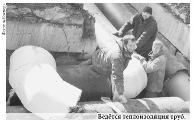
Ведётся теплоизоляция труб.

На главный вопрос «о парилке» специалист ответил, что свою работу они выполняют качественно и отвечают за неё стопроцентно. Проблема горожан решается, а это значит, что власти действуют в правильном направлении теплосбережения.