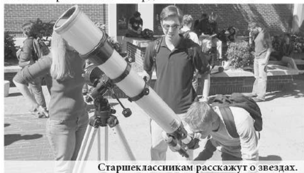
Старшеклассникам расскажут о звездах.

Одним из нововведений в 2017-2018 учебном году станет появление в школьном расписании астрономии. Как отмечают в региональном мин-образовании, пока не внесены изменения в базисный учебный план, но рекомендации министерства образования и науки России уже доведены до школ. Планируется, что новая дисциплина по решению школ появится в расписании учеников 10-11 классов. Предполагается, что повышение квалификации педагогов будет проводиться в Институте развития образования Свердловской области.