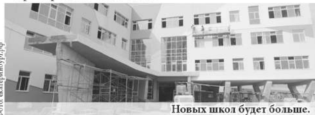
Новых школ будет больше.

В настоящее время в Екатеринбурге идёт строительство второй очереди школьного комплекса в Академическом районе, в посёлке Мичуринский возводится образовательный центр, а в Полевском – пристрой к школе №14.