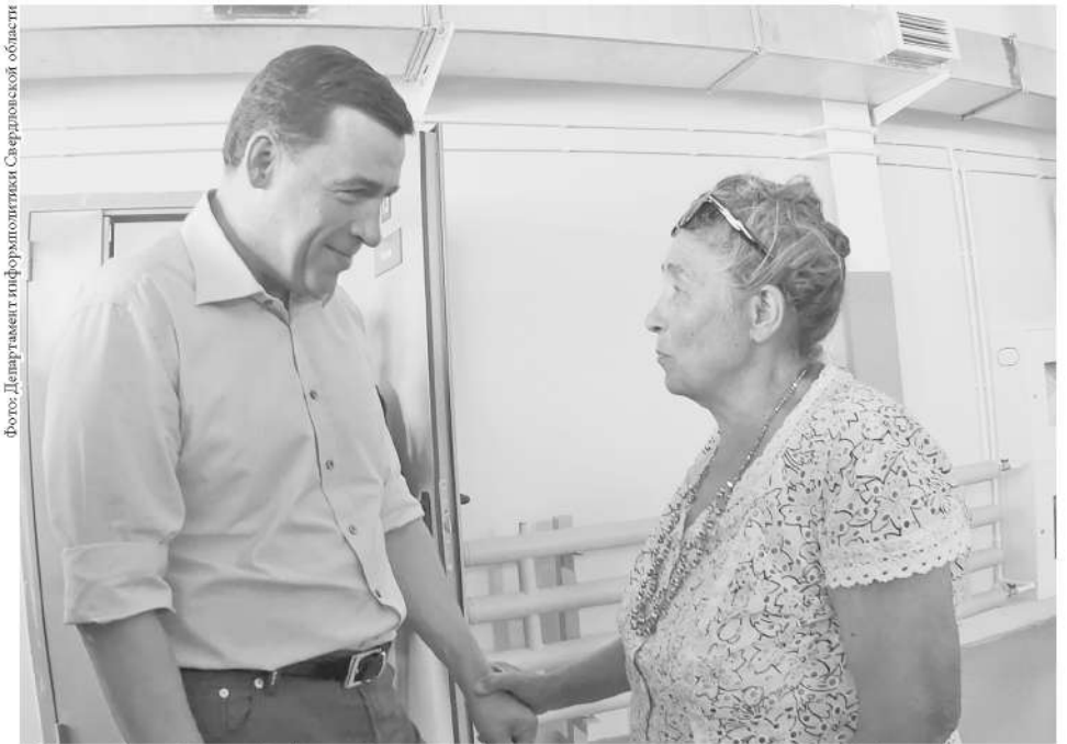
Учреждённый главой области Евгением Куйвашевым в 2013 году праздник – День пенсионера – стал социально значимой инициативой, получившей широкую поддержку уральцев.

На теплоходе «Александр Фадеев» в сентябре 2017 года 65 человек отправятся в Самару, Саратов, Волгоград, Елабугу, Ульяновск, Сарапул. Они проведут встречи с ветеранами, молодёжью, представителями органов власти, возложат цветы, венки к памятникам, обелискам.