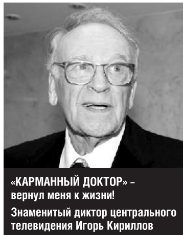
«КАРМАННЫЙ ДОКТОР» – вернул меня к жизни!

Счастье – это быть здоровым. Вы согласны? Ибо без здоровья нет, сил радоваться жизни. И даже для счастья в личной и семейной жизни и успеха в работе нам непременно нужно здоровье! Как обрести его, знают те, у кого есть «КАРМАННЫЙ ДОКТОР», творящий настоящее волшебство!