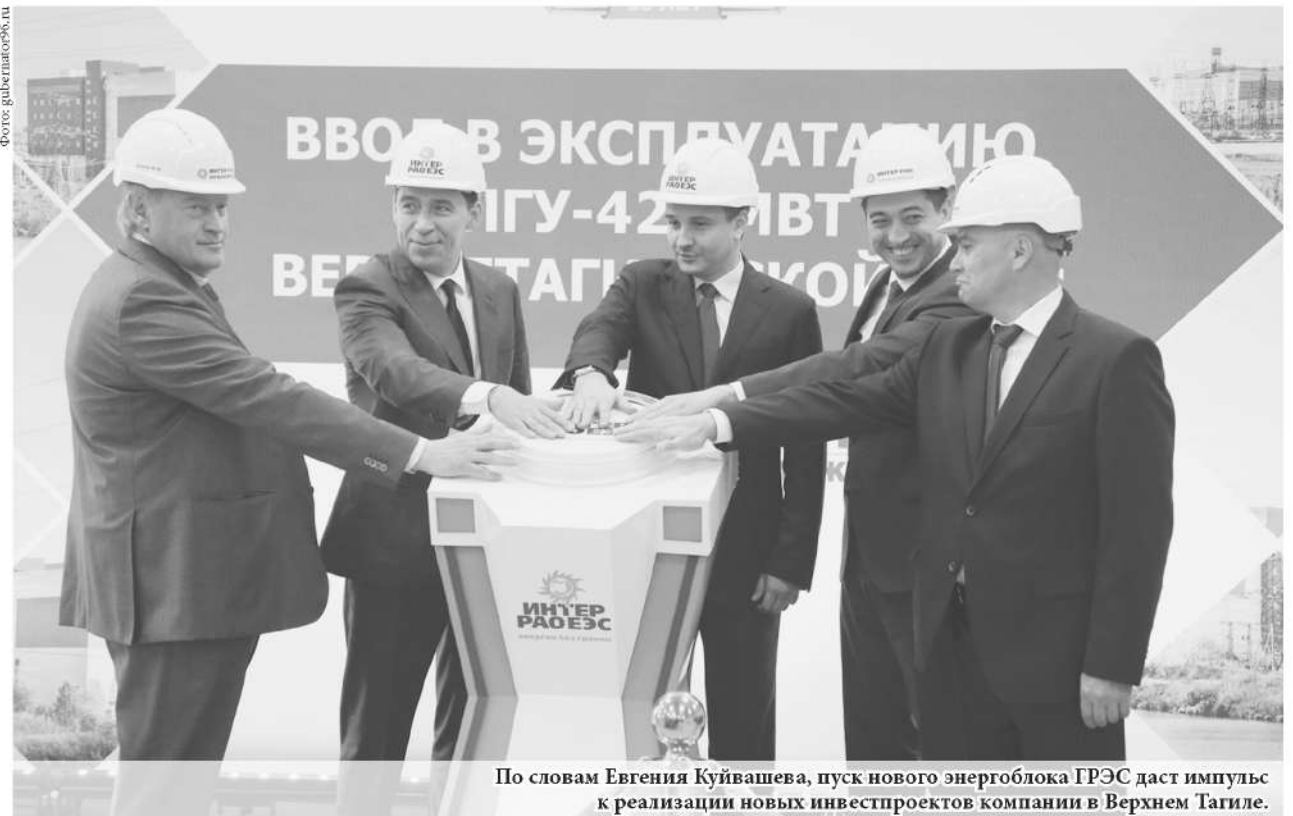
По словам Евгения Куйвашева, пуск нового энергоблока ГРЭС даст импульс к реализации новых инвестпроектов компании в Верхнем Тагиле.

Первые серийные КриоАЗС могут появиться уже в ближайший год и будут установлены в зоне производственной деятельности компании «Газпром трансгаз Екатеринбург».