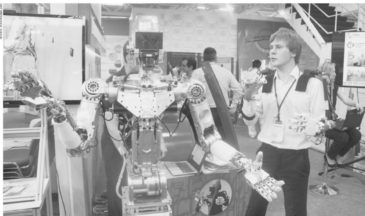
Создание полностью автоматизированного производства — главный тренд современной промышленности.

В этом году на выставку приедет более 400 представителей японской промышленности, бизнеса и власти. В национальной экспозиции будут представлены Toyota, Mitsubishi, Toshiba, Kawasaki Heavy Industries, Marubeni, Sojitz, JGC,