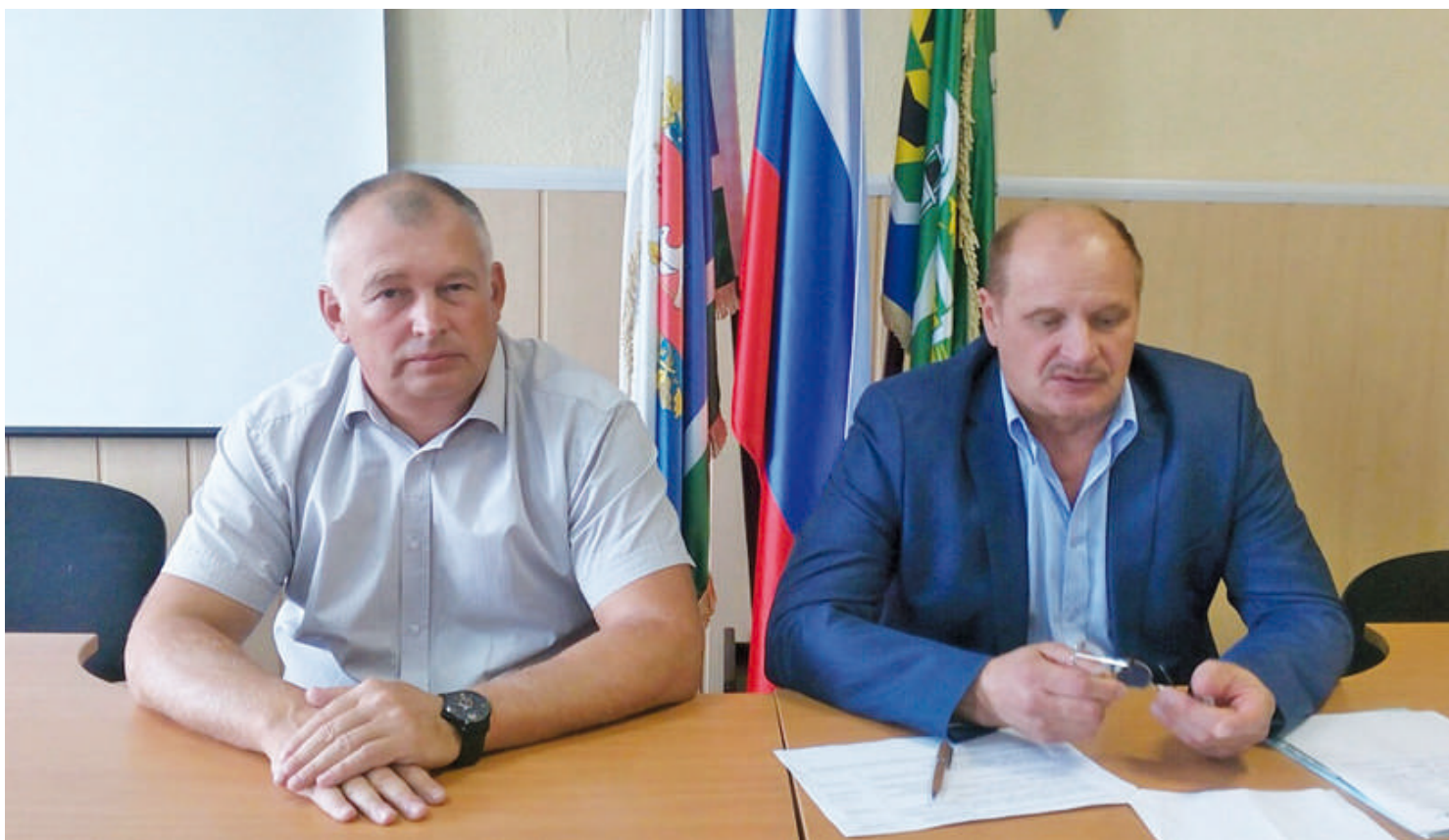
Демонтаж недостроенной семиэтажной поликлиники в Артёмовском запланирован на декабрь 2018-го.

Об этом в среду, 1 августа, на совещании, которое состоялось в конференц-зале администрации АГО, рассказал первый заместитель министра строительства и развития инфраструктуры Свердловской области Виктор Московских .