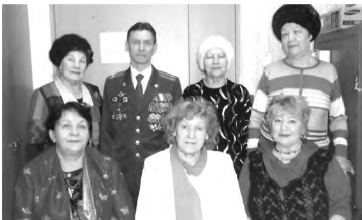
Члены бюро Талицкого городского Совета ветеранов

Председателем городского Совета, членами бюро, председателями первичных ветеранских организаций своевременно проводятся текущие дела и мероприятия по ведению документации, информированию пенсионеров о мероприятиях и освещению в СМИ по всем направлениям деятельности городского Совета ветеранов. Активисты приняли участие в благоустройстве «Сквера ветеранов», сборе макулатуры, в активной работе по вовлечению ветеранов в развитие их индивидуальных способностей по интересам. Это вязание, лепка, плетение и т.д. Многие ветераны прошли через школу пожилого возраста «Творческая прикладная деятельность» и «Компьютерная грамотность» при Комплексном центре Талицкого района; участвовали в работе клубов «Мир женщины», «Золотая осень». Впервые, в 2018 году, Талицкий городской