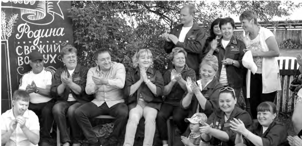
Фестиваль учащейся молодежи, 2017 год.