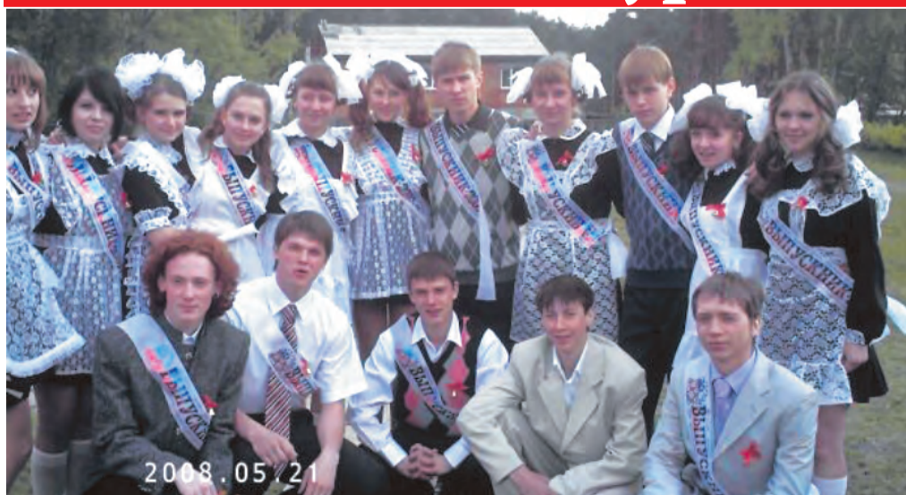
Последний звонок, 11 «Б» класс, 2008 год.