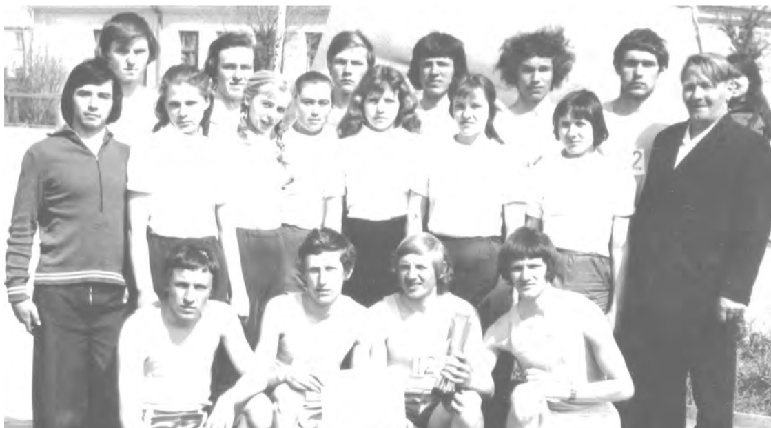
25 апреля 1976 года. Команда ТЛТ, занявшая первое место в городской эстафете на приз Н. И. Кузнецова.