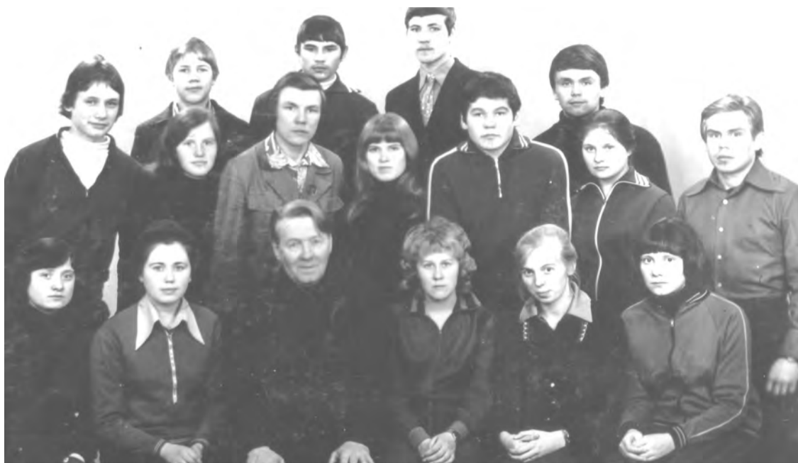
1978-1979 г. Команда ТЛТ по легкой атлетике.

Каждая фотография должна сопровождаться информацией о том, когда и где она сделана, что на ней изображено (или кто изображен), от кого получена.