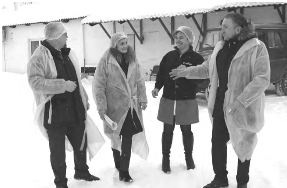
Гости на территории ЗАО «Талицкое»

- На сегодняшний день в цехе оборудованы рабочие места для людей с ограниченными возможностями здоровья, был