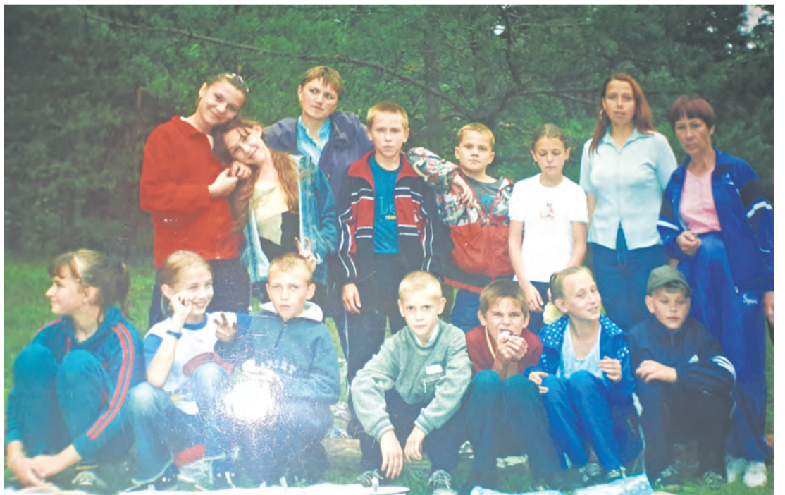
Осенний поход, 2003 год, 5 «б» класс, школы №55.