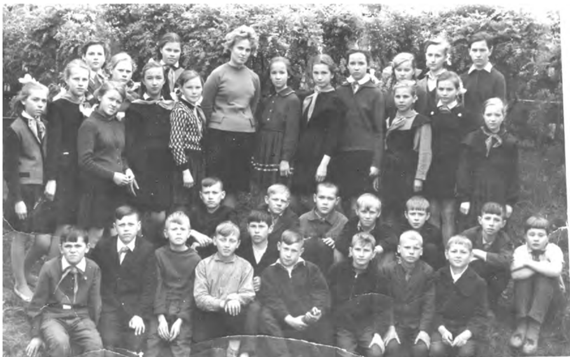
1965 г., г. Талица, 5 «а» класс школы № 1.

Каждая фотография должна сопровождаться информацией о том, когда и где она сделана, что на ней изображено (или кто изображен), от кого получена.