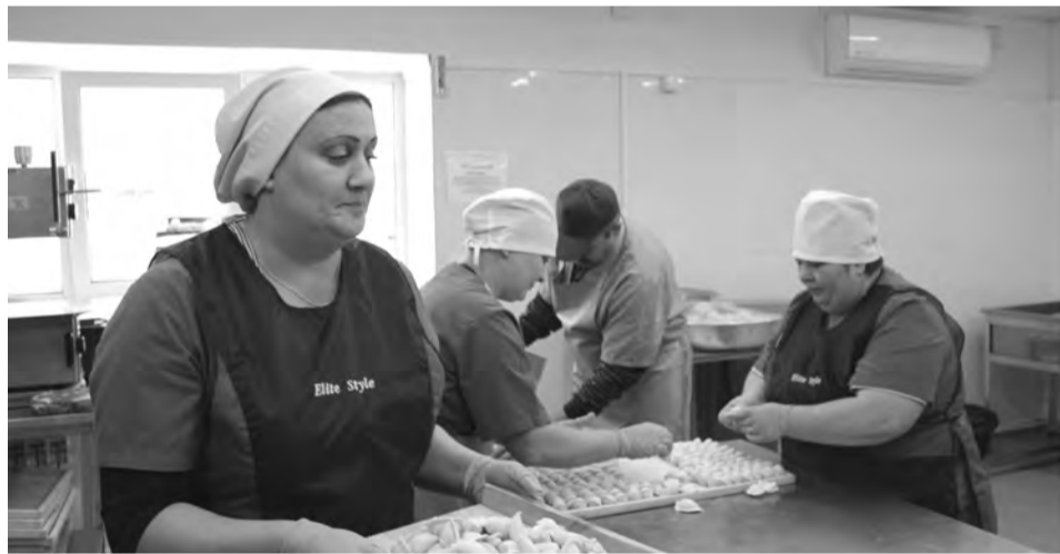
В цехе полуфабрикатов