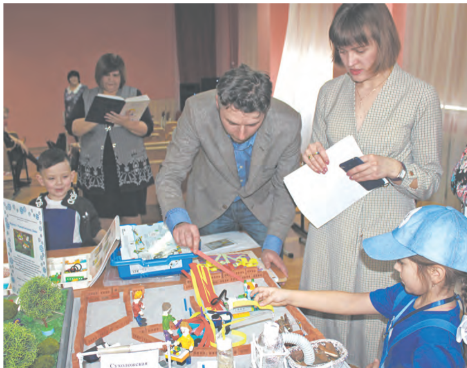
Процесс оценивания проекта дошкольников

В номинации «3D-моделирование» первое место заняла коллективная работа учащихся Троицкой школы №5 «Поселок Троицкий в 2025 году». Второе