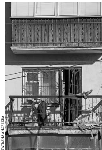
Жильцы обязаны обеспечить доступ к общему имуществу собственников дома.