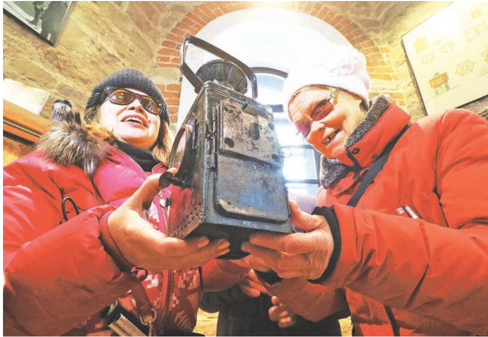
В помещении водонапорной башни экскурсантов заинтересовал старинный керосиновый фонарь.

В Екатеринбурге проложили туристический маршрут для незрячих