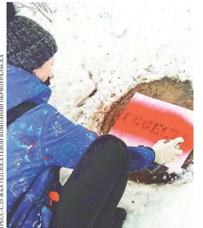
Таким необычным способом активисты надеются в том числе призвать похитителей люков к совести.

В январе правоохранители и коммунальщики забили тревогу: в Первоуральске эпидемия краж люков. Только за последние недели воры унесли 12 технологических крышек. Действуют злоумышленники не только во дворах отдаленных районов, но и в центре города — на улице Герцена. Полиции удалось задержать только одного грабителя: в пунктах приема металлолома держат оборону и не сдают поставщиков чугуна.