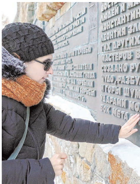
Екатеринбуржцы кончиками пальцев «прочувствовали» достопримечательности родного города.

Так появилось несколько вариантов экскурсий по историческим местам. Помимо проекта для незрячих, это путешествия для людей с нарушением слуха, проблемами опорно-двигательного аппарата или ментальными особенностями. Для каждого готовится