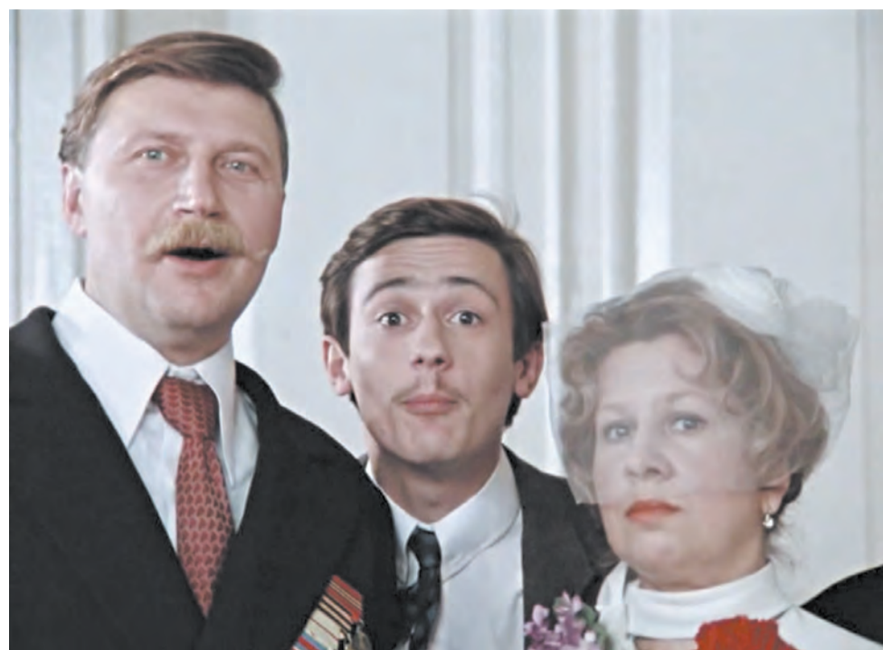
Кадр из фильма «Покровские ворота».