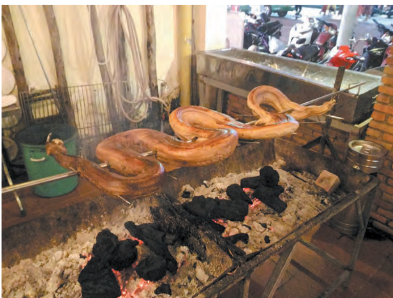
Для желающих готовили змею.