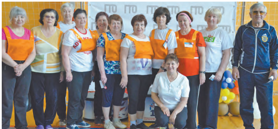
Группа здоровья «Факел».

Одним из ярких событий 2018 года для пенсионеров стало выполнение нормативов всероссийского физкультурно-спортивного комплекса «Готов к труду и обороне».