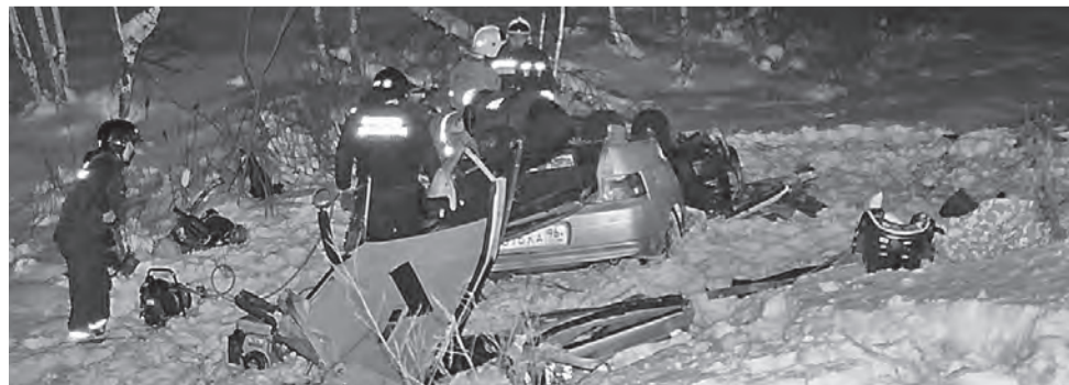
Очевидцев ДТП, которое произошло 3 января, в 20 часов 50 минут, на 48-м километре трассы Николо-Павловское – Алапаевск, в районе деревни Беляковка, с участием лесовоза Freightliner и автомобилей ВАЗ-2112, Kia Rio и Nissan, просят откликнуться родственники участников ДТП и позвонить по телефону 89122424552.

- Уважаемые водители, выбирайте такую скорость, которая обеспечит безопасность дорожного движения, скорость не должна превышать установленные ограничения, - убедительно напоминают инспекторы ГИБДД. - Во время неблагоприятных погодных метеорологических условий лучше избегать маневров обгона, соблюдать дистанцию и обязательно пользоваться ремнями безопасности, детскими креслами.