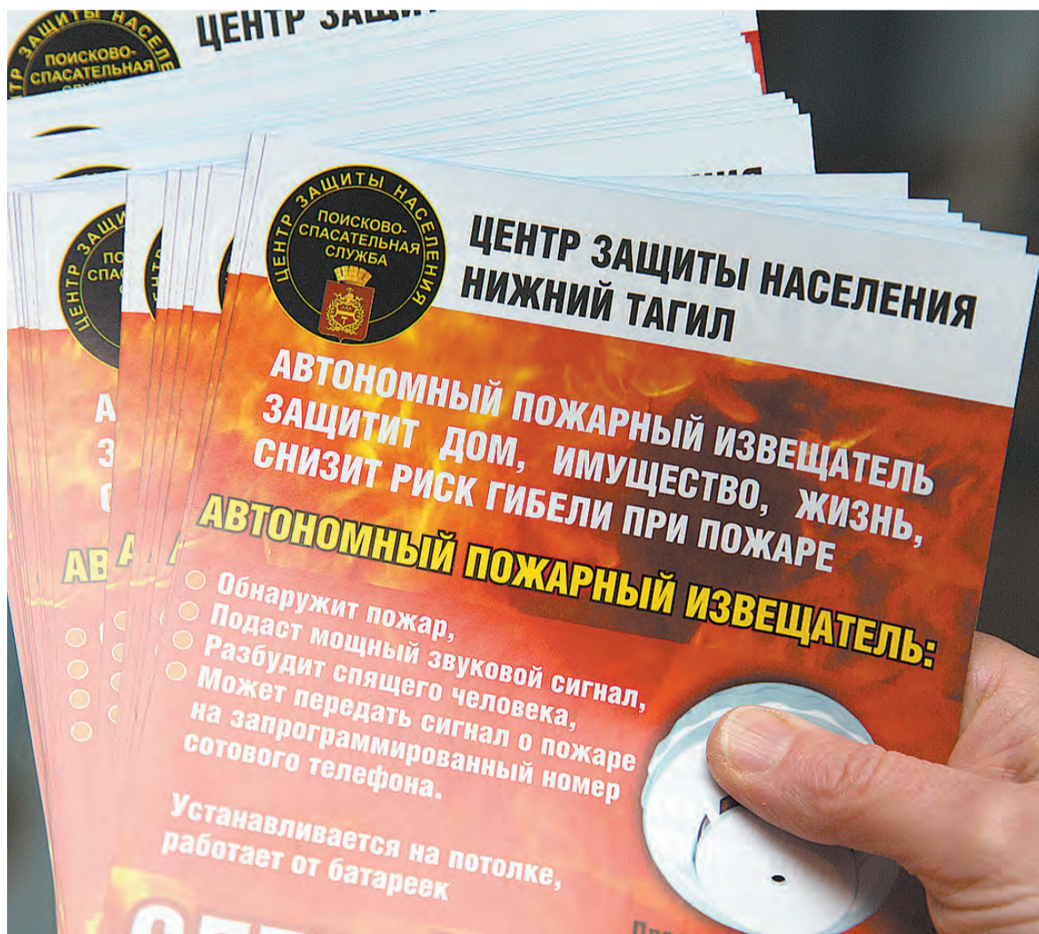
Такие памятки раздают жильцам дома.

2019 год начался с трагедии. Утром 31 декабря на улице Карла Маркса в Магнитогорске обрушился подъезд 10-этажного дома. Причиной обрушения, по официальным данным, стал взрыв бытового газа. Под завалами погибли 39 человек.