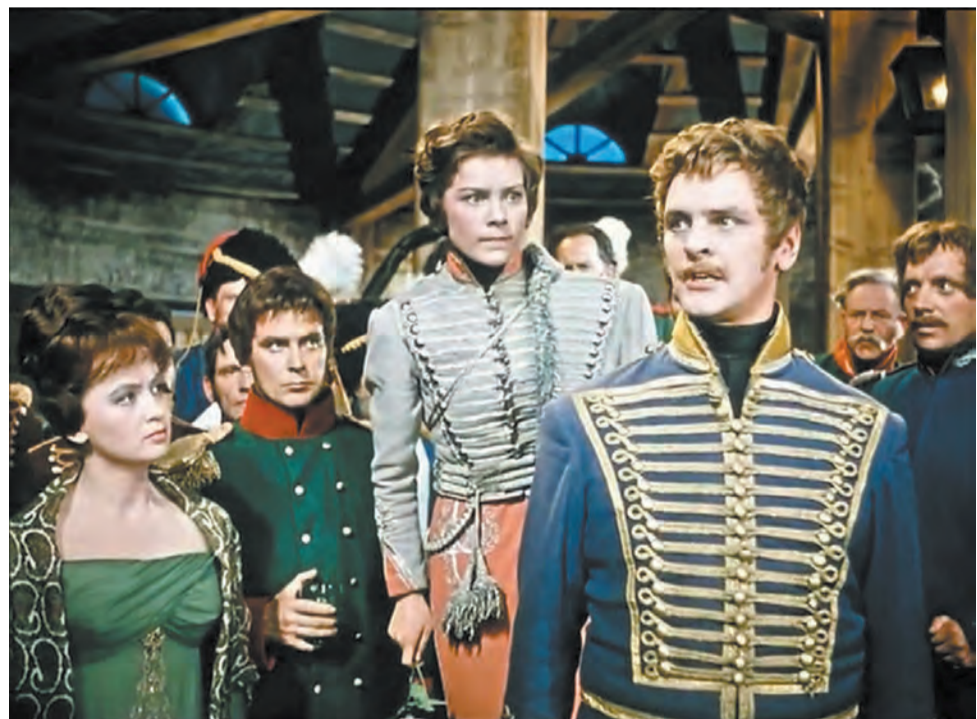
Кадр из фильма «Гусарская баллада».

Одна из самых обсуждаемых в Интернете тем во время новогодних праздников – праздничная телепрограмма. Вот уже несколько лет зрители ругают «голубые огоньки» и подборки фильмов, но при этом продолжают их смотреть.