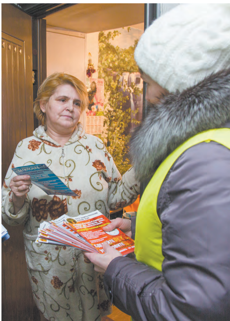
Цель рейдов – напомнить горожанам элементарные правила безопасности.

В нашей стране чужой беды не бывает, поэтому, как добрые соседи, мы готовы оказать всестороннюю поддержку и помощь. Нижний Тагил с вами!»