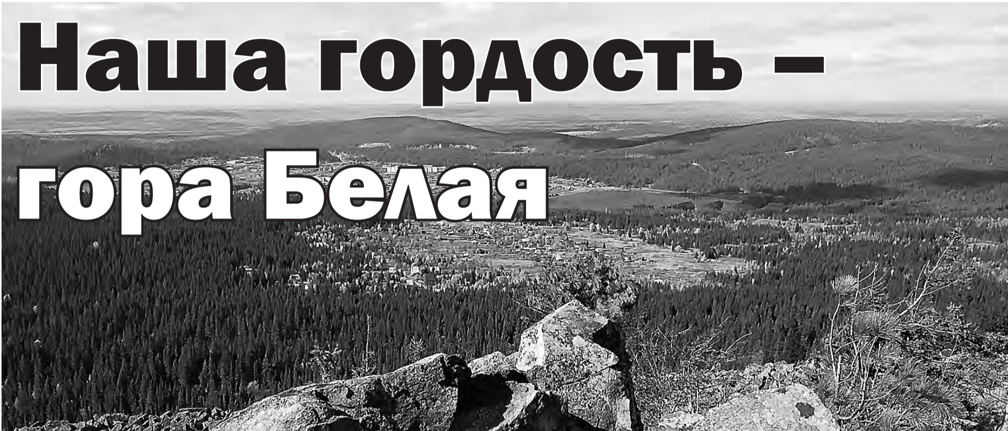
Вид с Белой горы.

Гора Белая находится в 30 километрах к юго-западу от Нижнего Тагила и составляет северную часть Веселогорского хребта, протянувшегося в меридианальном направлении на 40-50 километров. Вокруг возвышаются горные вершины высотой до 700 метров. Название дано по различным причинам: светлые породы, слагающие гору, березовый белый лес на склонах. Местные жители утверждают, что на этой горе раньше выпадает и позднее сходит снег.