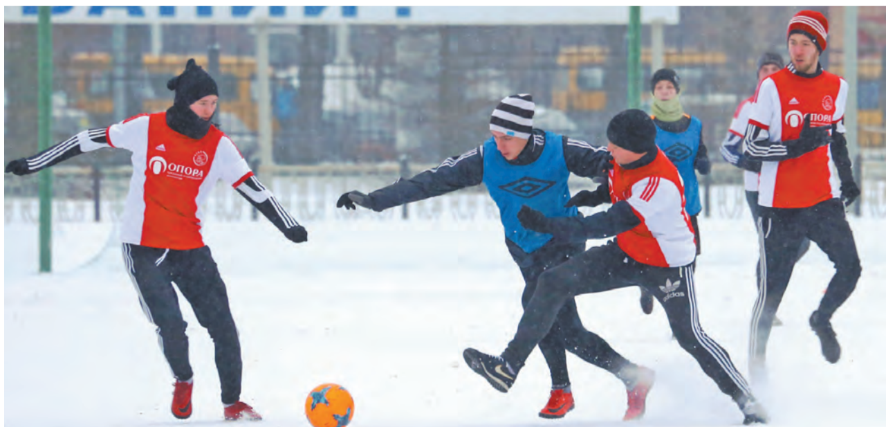
Момент матча «Спутник» - «Аякс» (красно-белый верх).

В декабре стартовал зимний чемпионат Свердловской области по футболу среди мужских команд. В первых матчах зафиксированы такие результаты: «Академия Урал» (Екатеринбург) – «Жасмин» (Михайловск) - 3:0, «УрФУ» (Екатеринбург) - «Ураласбест» (Асбест) - 2:2, «Жасмин» (Михайловск) - «Ураласбест»