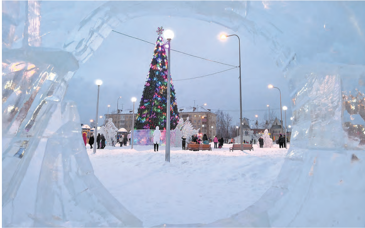
Главная вагонская елка.