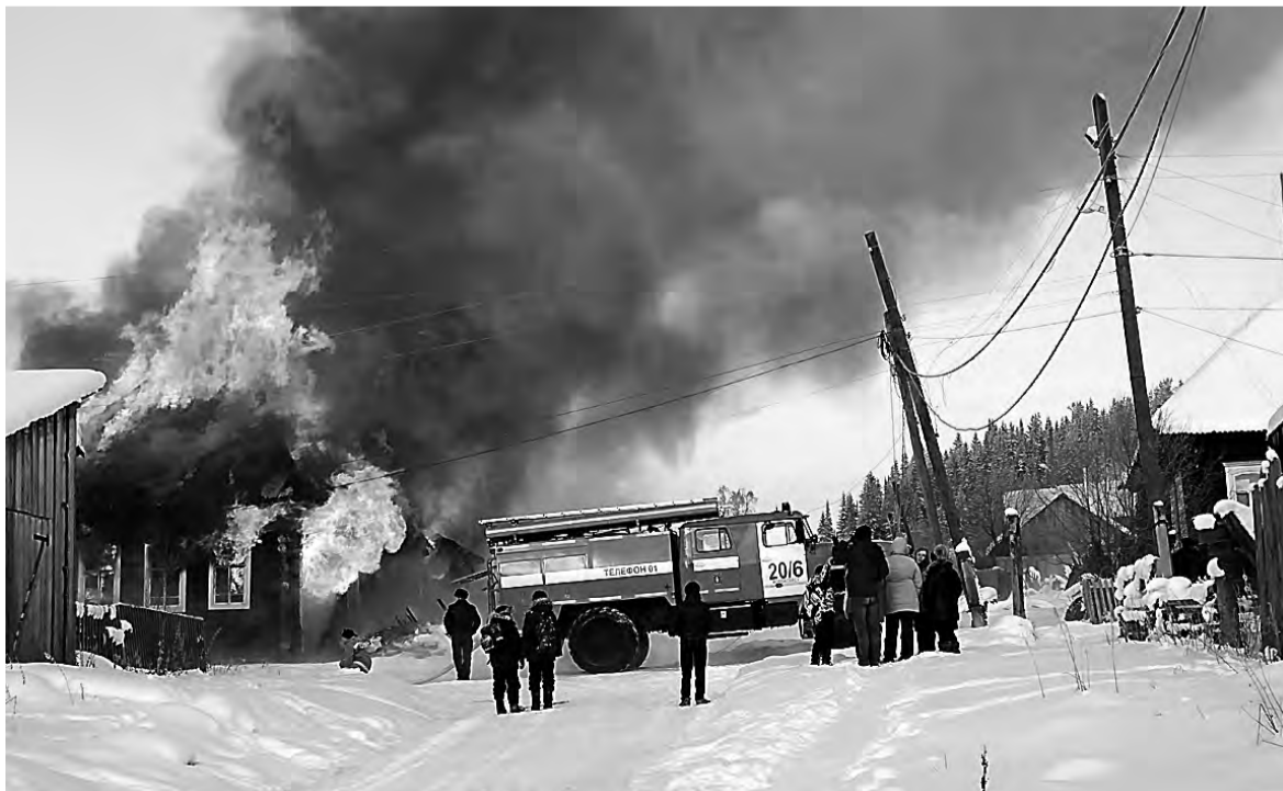
Пожар в Серебрянке.