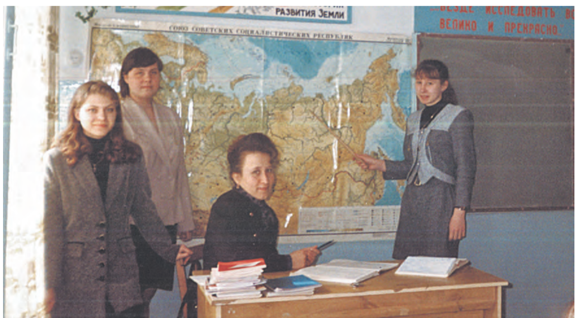
Школа № 1, 11 «А» класс на уроке географии. 20 лет назад...

Даём старт фотоконкурсу «Одноклассники», ждём ваших фотографий!