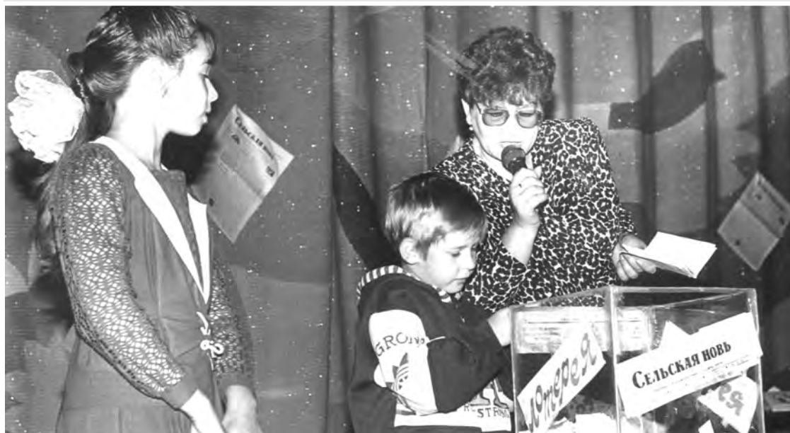
1999 г. Разыгрывается лотерея районной газеты «Сельская новь». г.Талица, Дом культуры.

Каждая фотография должна сопровождаться информацией о том, когда и где она сделана, что на ней изображено (или кто изображен), от кого получена.