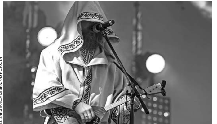
Нейромонах Феофан никогда не показывает лицо.