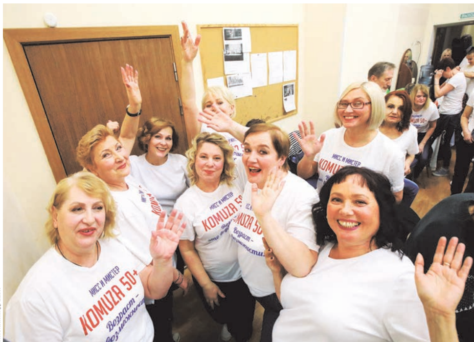
Движение KOMUZA 50+ объединило тех, кто не хочет мириться, что их называют «пенсами».