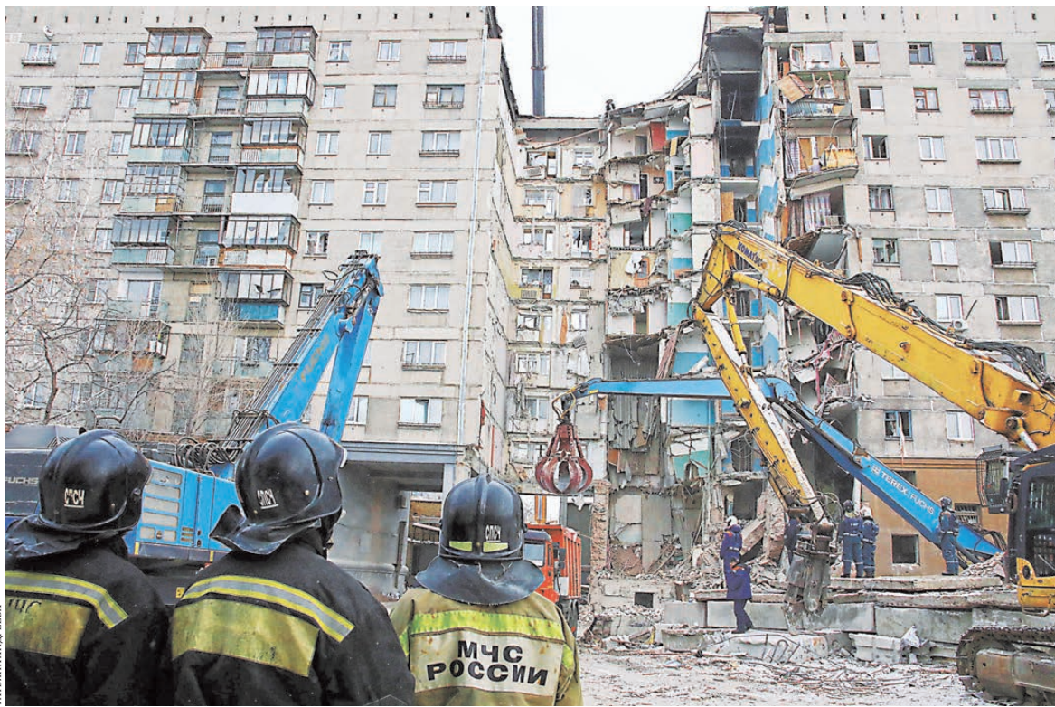
Спасатели разбирали завалы и днем, и ночью.