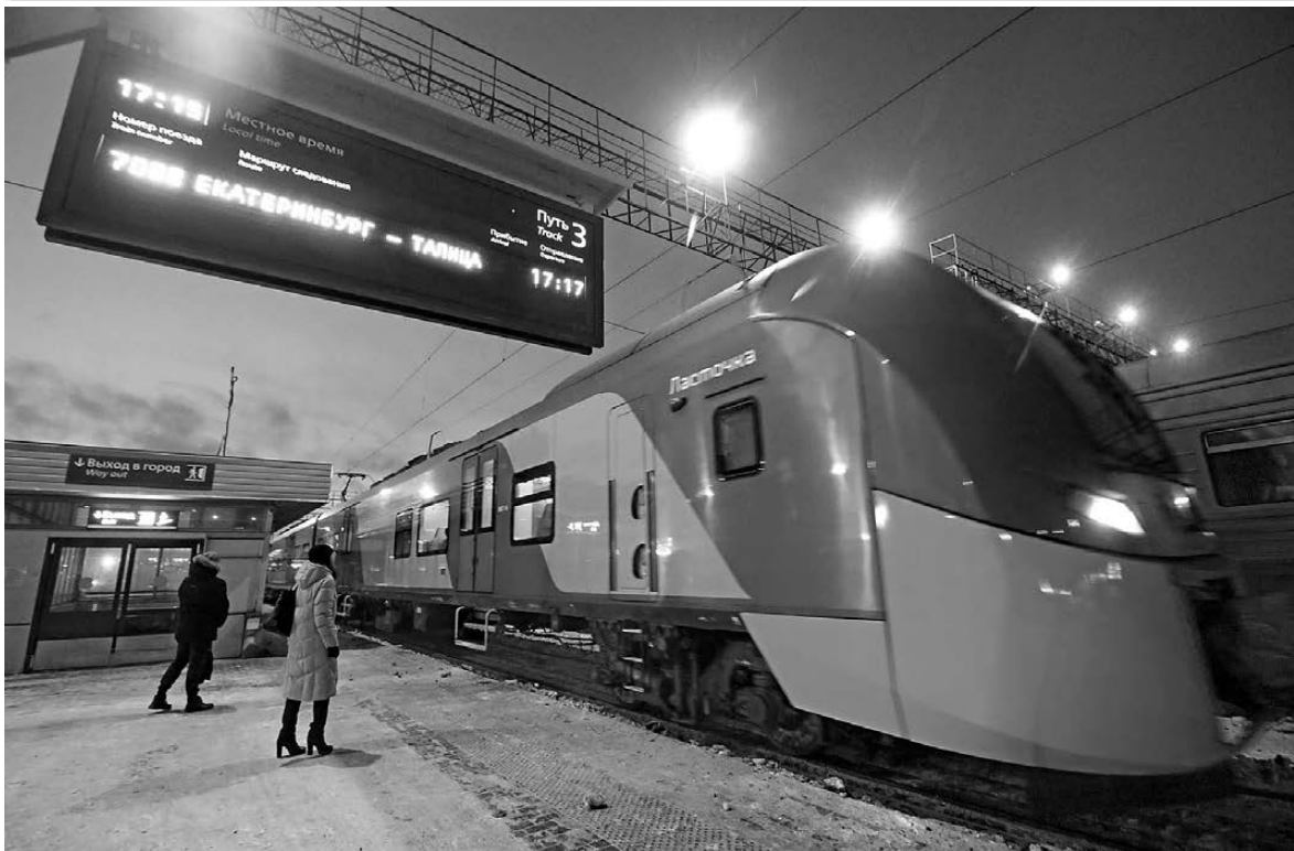
Скоростной электропоезд «Ласточка» соединил Екатеринбург и Талицу. Прежде «Ласточки» ездили до Нижнего Тагила, Каменска-Уральского и Кузнецкого. Чтобы добраться из среднеуральской столицы до отдаленной Талицы, пассажирам приходилось совершать пересадку на станции Ощепково. С запуском «Ласточки» на тюменском направлении время в пути сократится почти на час.