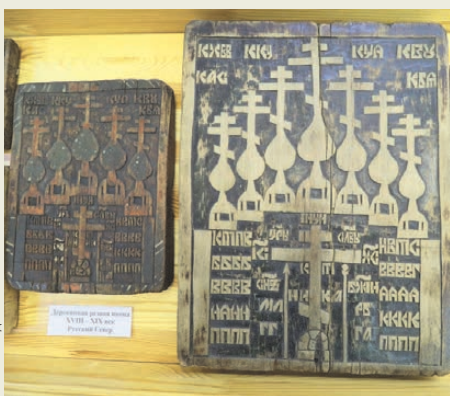
Деревянная резная икона XVIII—XIX вв.

Выставка в музее Невьянской иконы в Екатеринбурге раскрывает малоисследованный и таинственный пласт народной культуры—народную икону, созданную в пяти иконописных центрах России (в сибирских Сузуне и Армиозне, в Холуе, Приднепровье и Красноуфимске). Долгое время к народной иконе относились как к своего рода культурному «шлаку», недосягаемому как до церковного канона и статуса святыни, так и до живописных догматов и звания произведения искусства. Только сейчас мы созрели до того, чтобы взглянуть на нее непредвзято. Экспонаты для первой большой выставки народной иконы собрала Российская академия художеств в 2012-м.