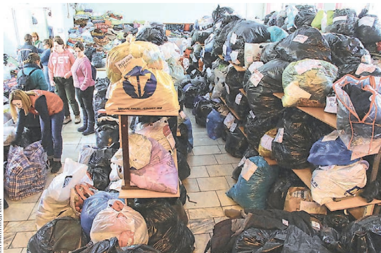
Принесенные магнитогорцами вещи для пострадавших заполнили весь актовй зал школы.