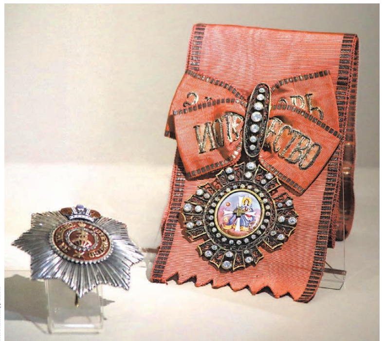
Музей военной техники из Верхней Пышмы предоставил для выставки усыпанную бриллиантами звезду и крест ордена Святой Екатерины.