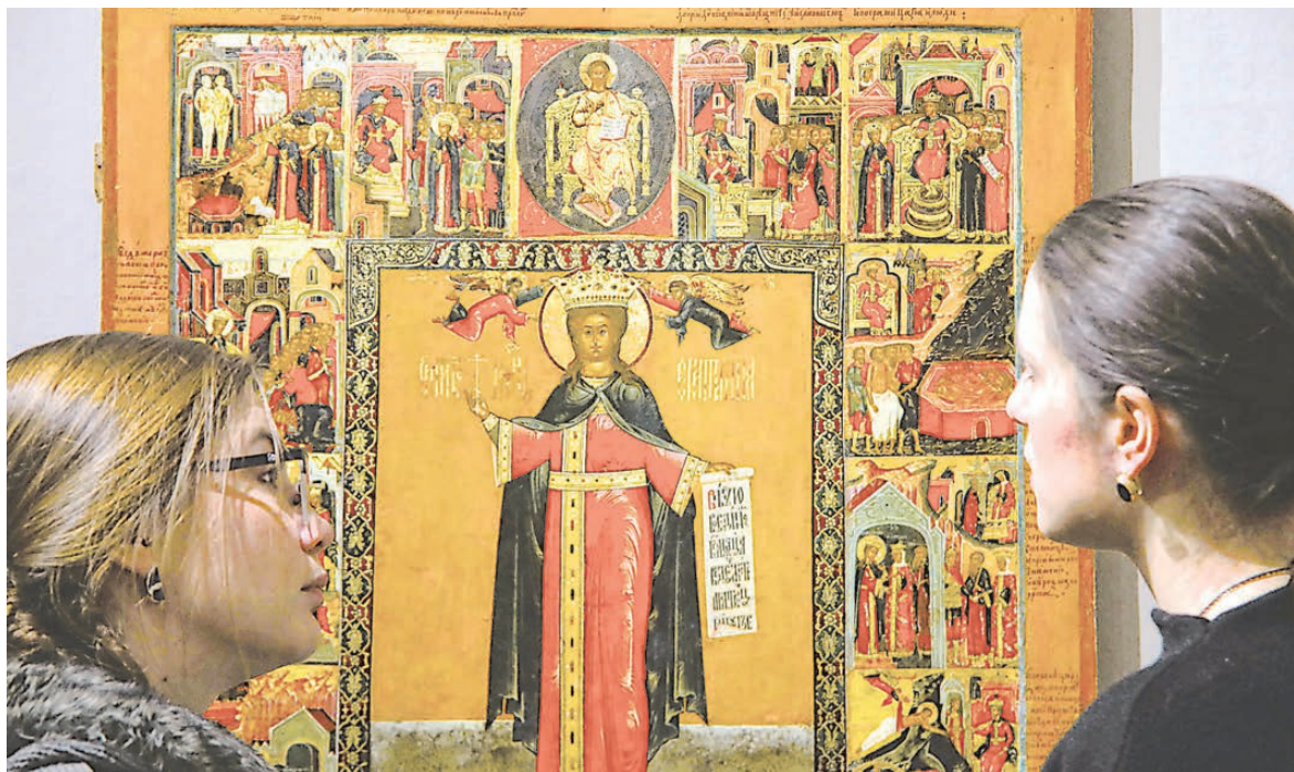
Редкая икона XVIII века «Житие Святой Екатерины» из коллекции Ярославского художественного музея.

Школьники знают, в честь кого назван Екатеринбург, а большинство взрослых—нет