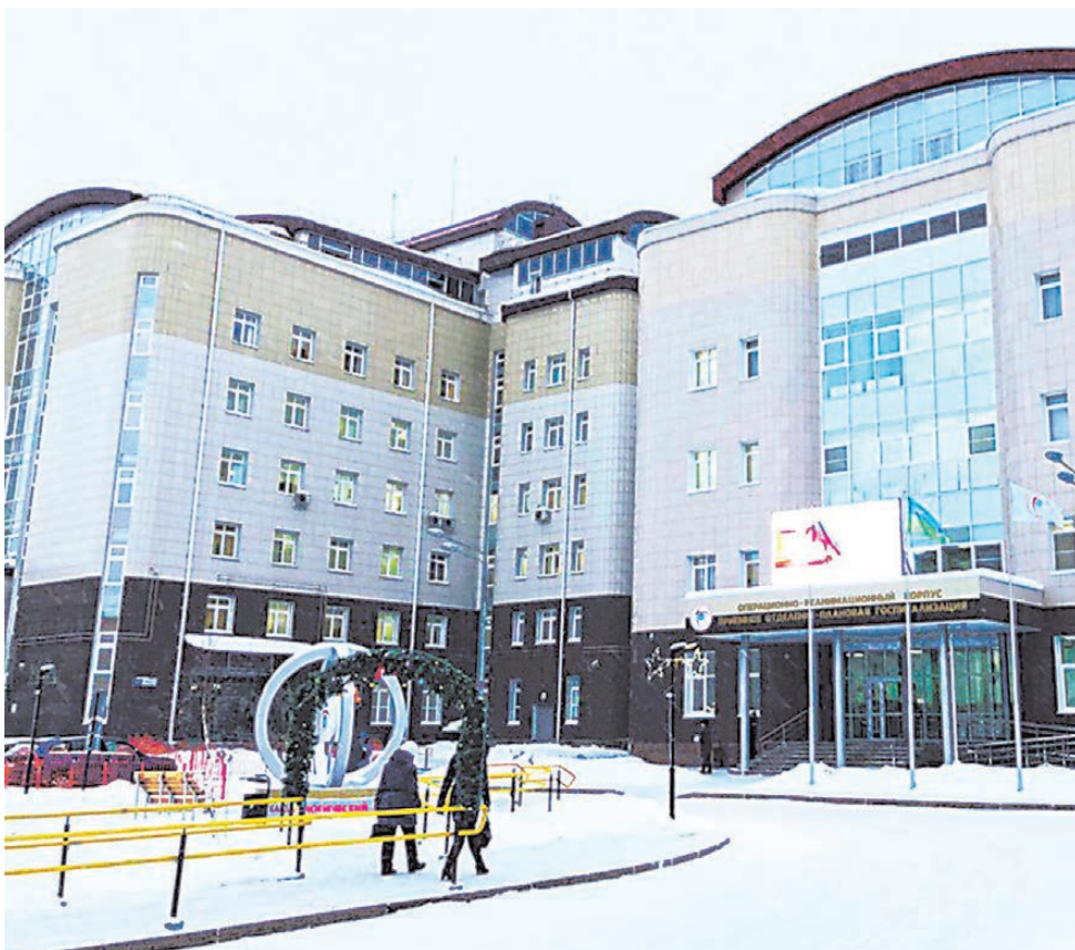
В окружном центре диагностики и сердечно-сосудистой хирургии, открытом в Сургуте весной прошлого года, оперируют и новорожденных с патологиями, и долгожителей. Возраст самого пожилого пациента — 97 лет, ему имплантировали электрокардиостимулятор.

Не все из передовых начинаний потребовали серьезных финансовых вложений. Многие зародились из простого желания докторов сделать приятное землякам. К примеру, почти перед всеми больницами и поликлиниками Сургута задолго до Нового года появились праздничные ели. Каждая — со своей фишкой. Около уже упомянутой четвертой поликлиники сверкающий огоньками олень везет санки с «мешком здоровья». Перед кардиоцентром красуется веселый снеговик с огромным шприцем, вроде того, что используют герои комедии «Кавказская пленница». А у детской поликлиники расположился доктор Айболит с компанией зверей. Вроде бы мелочь, но знаю точно: не каждый глав-