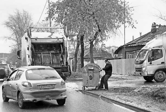
Норматив накопления мусора в частном секторе Челябинска — 1,6 кубометра на человека.