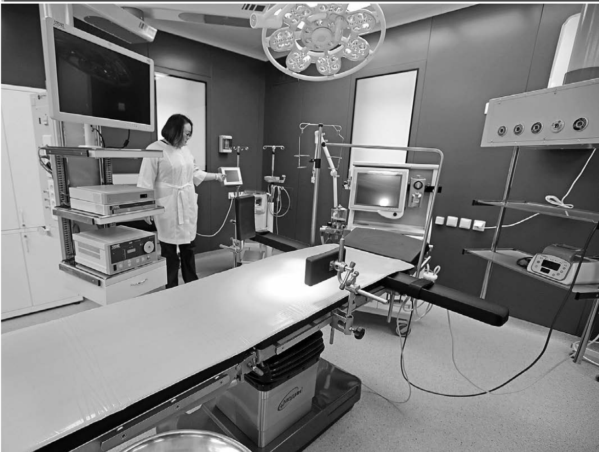
На Среднем Урале завершилась реконструкция хирургического корпуса и операционного блока Верхнепышминской центральной городской больницы им. Бородина. На капитальный ремонт и оснащение медицинского учреждения новым оборудованием областной бюджет выделил более 210 миллионов рублей. От постройки 1973 года остались только стены.