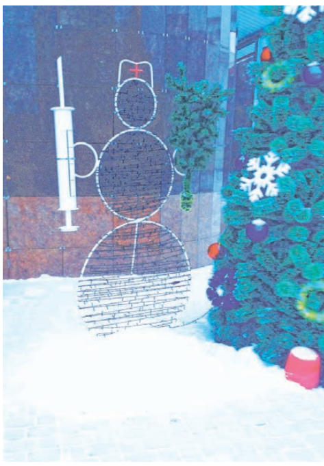
Медик-снеговик с полуметровым шприцем в руках, установленный перед входом в центр, по мнению врачей, символизирует готовность вылечить любого, кто переступит порог больницы.

врач готов разориться на уличные «украшалки».