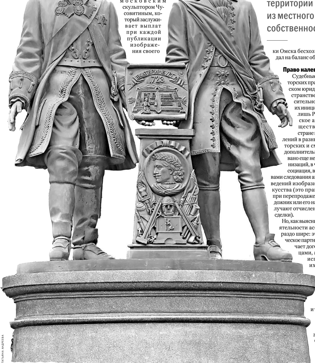
Фигуры отцов-основателей города де Геннина и Татищева похожи, как близнецы, хотя в жизни это было совсем не так.

Памятник Татищеву и де Геннину — историческим личностям, благодаря которым расцвел наш горнозаводской край, к 275-летию Екатеринбурга, в августе 1998-го, установили в самом центре города. Хотя один из отцов-основателей был высоким, а второй — коротышкой, в бронзе они похожи, как близнецы. В народе памятник, не обладающий явными художественными достоинствами, сразу же окрестили «Бибусом и Баттхедом». Площадка у его основания — излюбленное место встреч скейтбордистов и роллеров.