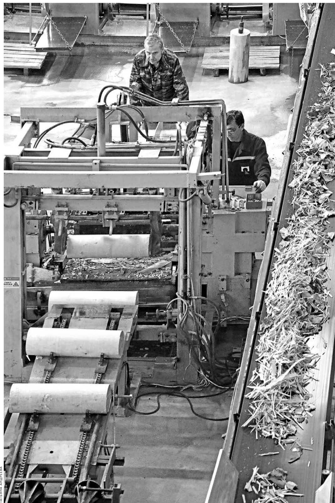
Развитие лесопереработки поможет решить проблему с занятостью в глубинке.

Согласно официальной статистике, объем вложенных в 2017 году средств во все инвестпроекты составил 448,3 миллиона рублей. Выделенный объем лесного фонда—531,4 тысячи кубометров. Статистика за 2018-й в целом пока нет, только за девять месяцев: вложен 361 миллион рублей, выделено за это же время леса—264 тысячи кубов. Чиновники минпрома полагают, что развитие новых производств поможет решить проблему занятости в уда-