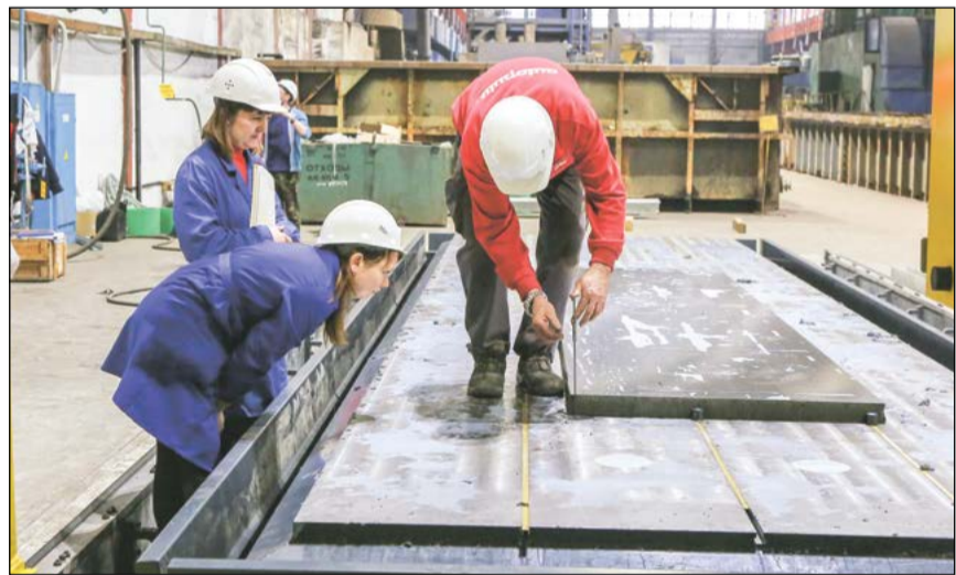
Технологи контролируют качество обрабатываемой поверхности