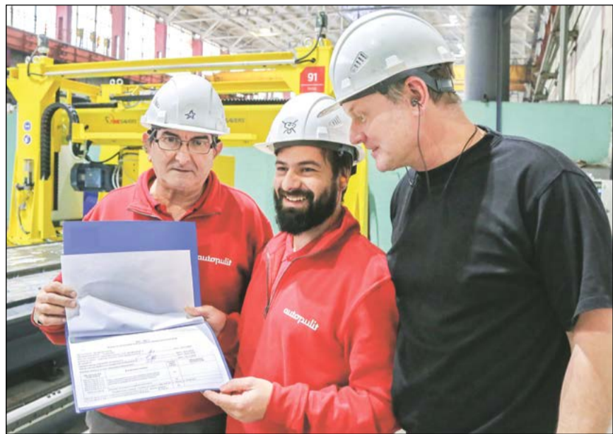
Представители фирмы TimeSavers проводят сверку документов

Специалисты голландской фирмы TimeSavers смонтировали в цехе № 16 ВСППО новый вертикально-шлифовальный станок.