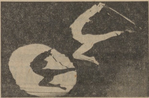
Этот снимок сделан на концерте во Дворце культуры и техники Новотрубного завода. Это лишь один из номеров богатой программы, подготовленной нынче народным цирком.