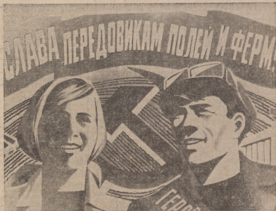
Плакат художника Е. Рожкова. Издательство «Плаката».

Горком КПСС, исполком городского Совета народных депутатов.