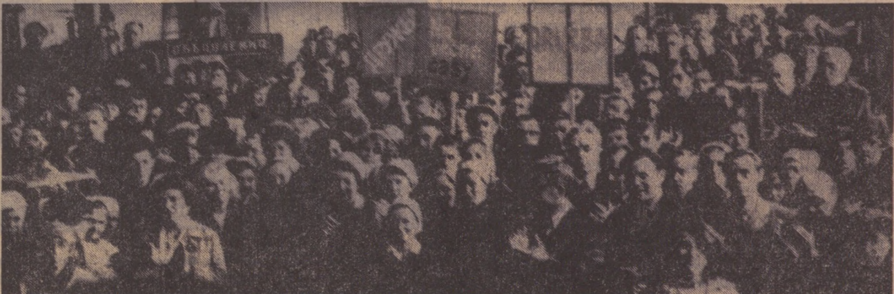
МАСТЕР — ОРГАНИЗАТОР И ВОСПИТАТЕЛЬ