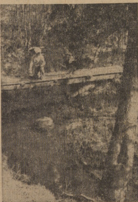
Природы тихий уголок.