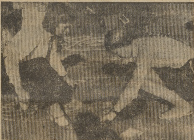
В пионерлагере «Огонек» конкурс рисунков на асфальте собрал множество участников.

А. ЕКИМОВА, член совета ветеранов труда.